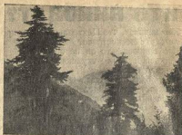
Включите горы и ущелья в инвентарь ваших спорт-кружков.

правлениям: учебная—уроки, физкультминутки, теоретический курс; массовая—бег, кружки, физкультура на практике; в рабочей консультации—осмотры, консультации, санпросвет; научно-исследовательская—разработка специфика учебно-задачей и выработка стандартов.