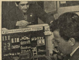
Студенты-исполбюро Воронежского университета имеют кооператива.

Не случайно поэтому появилась в № 4 стенгазеты вузоборотецки ВЛКСМ ИХХ «Большественский молодежь» статья «Внимание интернациональной работе, утверждающая, что эта работа в ИХХ совсем заброшена: на нее обращают внимание только по праздникам, в юбилейные дни и в день МОПРа. Автор статьи совершенно правильно ставит основными задачами интернациональной работы, установление связи по комсомольской линии через переписку ячеек и отдельных групп, проведение метода социорезонанса, изучение опыта работы комсомольских организаций, установление связи с политэмигрантами, находящимися в Москве, освещение вопросов международной революционной борьбы на полит- и тематических кружках и в партакбюте. Надо надеяться, что комсомольская ячейка ИХХ, проработавшая большую работу по перестройке учебы в Институте, справится и с этим делом.