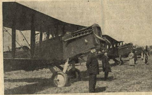
В рады воздушного флота встал самолет «Пролетард». Передан 1 мая на аэр.-дроме Москвы.

Куда ж годится? Но, кроме того, что же дает нам эта звучащая неприличия, как анекдот, студенческая столовая. Почему вошла в жизнь поговорка: «го-лодный, как студент». Бронная? С утра до ночи морковные биточки.