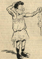
Рис. А. Маленинова