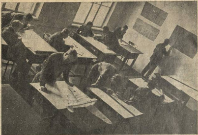
Кабинет аэродинамики ДПИ.