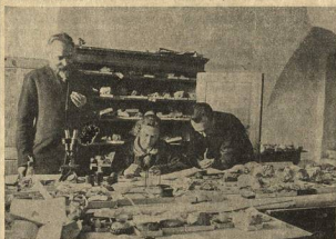
Казанский университет. Геолог изучает материалы разведок.

(Из решения ноябрьского пленума ЦК о кадрах.)