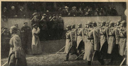
Парад на Красной площади—Красная армия.

Реформа придала учебе студенчества характер ударности. По всем линиям университетской жизни заметно подтягивается дисциплина.