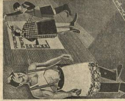
Что это за студент?

В работе Президиума ЦК профстудента участвуют представители всех факультетов. Президиум ЦК профстудента проводит работу по организации культурно-бытовых связей, а также по организации культурно-бытовых связей с другими факультетами. Президиум ЦК профстудента проводит работу по организации культурно-бытовых связей с другими факультетами. Президиум ЦК профстудента проводит работу по организации культурно-бытовых связей с другими факультетами.