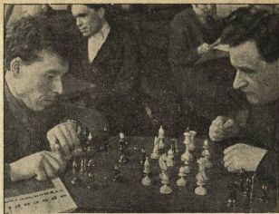
В общештате Воронежского университета.

Еще один любопытный штрих. Комсомольская ячейка ИХХ завела переписку с одной заграничной ячейкой, но та перестала ей отвечать. Обидчивая ячейка ИХХ так же прекратила переписку: «Наши ребята тоже гордые.