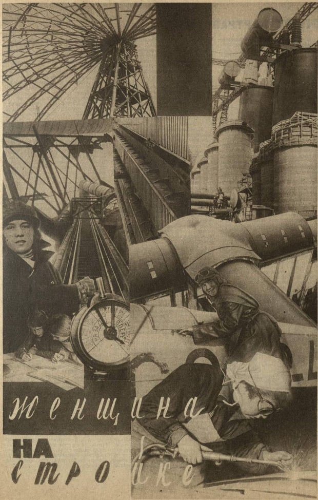
МОНТАЖ РАБОТ. ХУД. А. НИТОМИРСКОГО