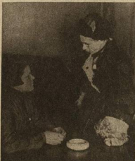
24 В ПЕРЕРЫВ ДЕЛЯТСЯ ОПЫТОМ СВОИХ КОММУН...

Имеем ли мы сейчас такие условия? Да, мы имеем сейчас то, чего не имели 3—4 года назад. В о-первых, значительное улучшение материального благосостояния студенчества, в о-вторых, увеличение рабочей прослойки, примерно с 25—30% до 70—75%.