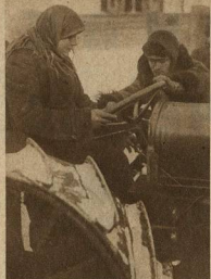
КОЛХОЗ ИМ. ОКТЯБРА КОЛХОЗНИЦА-ТРАКТОРИСТКА