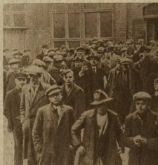
ГЕРМАНИЯ. ЗАДОЛГО ДО ОТКРЫТИЯ БИРЖИ БЕЗРАБОТНЫЕ ТОЛПЯТСЯ У ВХОДА

В СТРАНАХ КАПИТАЛА 35 МИЛЛИОНОВ БЕЗРАБОТНЫХ В СТРАНЕ СОВЕТОВ БЕЗРАБОТИЦА ЛИКВИДИРОВАНА