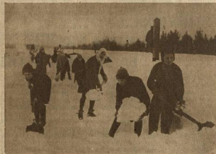
СТУДЕНТКИ УЧЕБНОГО КОМБИНАТА «ДИНАМО» ЗА РАСЧИСТКОЙ СНЕГА НА ШАТУРКЕ

ТАК — БЫЛО РАНЬШЕ! — ЕСТЬ ЕЩЕ ТЕПЕРЬ!! — НЕ ДОЛЖНО БЫТЬ!!