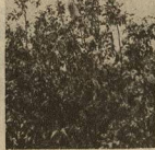
НАПРАВО ЧЕРЕМУХА НАЛЕВО ВИШНЯ В СЕРЕДИНЕ ПОМЕСЬ (ГИБРИД) У НЕГО 40—50 ЯГОД НА ОДНОЙ КИСТИ