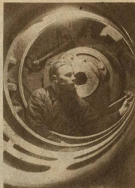
ЗАВОД „РУССКИЙ ДИЗЕЛЬ“