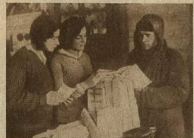
ХАРЬКОВСК. МАШИНОСТР. Т. У. И. МОБИЛИЗОВАННЫЕ НА ПОСЕВКАМПАНИЮ ПОЛУЧАЮТ ЛИТЕРАТУРУ