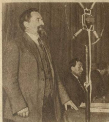
Тов. ЛОЗОВСКИЙ ДЕЛАЕТ ДОКЛАД О БЕЗРАБОТИЦЕ