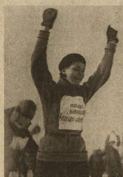
«ПРИВЕТ БОЙЦАМ КРАСНОЙ АРМИИ...»