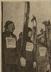
«ЗА УДАРНЫЕ ТЕМПЫ ДИРЖКАБЕ-СТРОЕНИЯ»