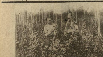
МИЧУРИН И ЕГО БЛИЗКАЯ ИЩИЦА ЯКОВЛЕВ В КОЗЛОВСКОМ ПИТОМНИКЕ