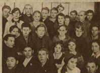
СТАЛИНГРАДСКИЙ Т-УМ МЯСН. ПРОМ.