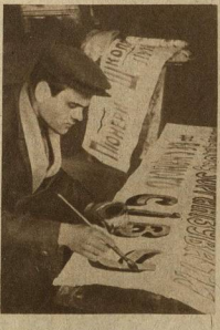
ХАРЬКОВСКИЙ МАШИНОСТРОИТЕЛЬНЫЙ Т-УМ