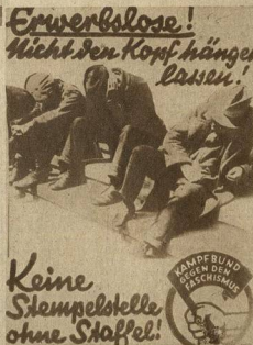
ПЛАКАТ НЕМЕЦКОЙ КОМПАТИИ