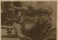
ХАРЬКОВСКИЙ ПОЛИТЕХН. И-Т