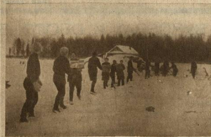
НАРАВНЕ С МУЖЧИНОЙ ЖЕНЩИНА ЛИКВИДИРУЕТ ПРОРЫВЫ НЕ БОЯСЬ ТЯЖЕЛОЙ РАБОТЫ