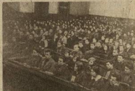
ОБЩИЙ ВИД СЛЕТА

МЕТОДОМ СОЦ-СОРЕВНОВАНИЯ И УДАРНИЧЕСТВА, ПУТЕМ ВЗАИМНОГО ОБСЛЕДОВАНИЯ КОММУН И КОЛЛЕКТИВОВ, ОПЫТ ЛУЧШИХ ПЕРЕНЕСЕМ НА ВСЕ СССР.