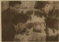
ХАРЬКОВСКИЙ ГЕОДЕЗИЧ. И-Т ПРАКТИЧЕСКИЕ ЗАНЯТИЯ