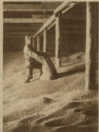
СОВХОЗ „ГИГАНТ“ СЕМЕНА ГОТОВЫ...