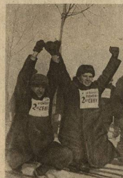
«ЗА РЕАЛЬНУЮ ПОМОЩЬ 2-й БОЛЬШЕ-ВИСТКОЙ ВЕСНЕ»