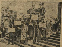
Революционные студенты потребовали на митинге: «Долой повязку со рта студента!». Мы те будем восстановить Хэрриса»