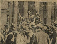
Несколько студентов, понявших начова «свобода слова» в банковской республике, завязали гот ст-т, е мудрости. Впрочем она и там молчала и не видела