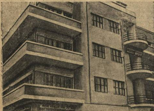
В Баку вырос еще один дом для студентов