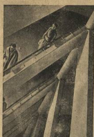
Лестница без ступеней. По такой без ступеней добравшись до 8 этажа