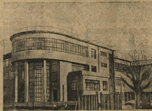
200 человек будет обучивать эта библиотека, построенная в Мінске