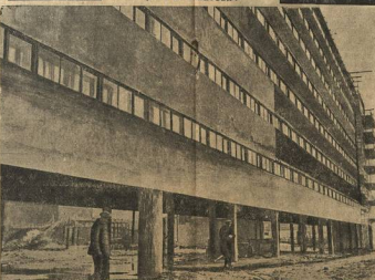
Это выстроил спальный корпус для 1.000 дворников. Увы, он до сих пор вадонорирован грязью и грудями строительного мусора

Зада отдыха, уютной холла для встречи гостей, туалетные комнаты (бритые, чистые, одесские, души), фойе-утилитарный зал — все приспособлено для поступления на бытовом фронте.