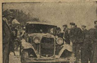
Делегацию студентов Нью Йорка, ехавшую обследовать условия расстрела шахтеров в Кентукки, полиция допустила только до границ штата Кентукки