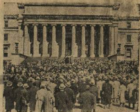
Протесту против исключения Хэрриса, 4000 студентов соваили летучий митинг и объявили однодневную забастовку