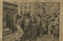
Под прикрытием ре тора фашисты пыт лись разогнать демонстрантов, о были избиты