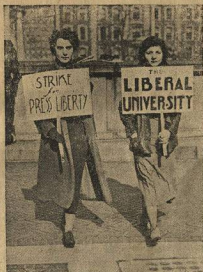
Студентки вышли под лозунгами: «За свободу печати», «За свободный университет». Свобода печати в Америке — это свобода для богатых, свобода для мучков

в жизни нет: на буфере, на задворках и то негде примоститься.