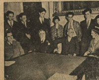
Все еще верящие в «объективность» правосудия, студенты пытаются обвинять действия властей сенаторам, тем же торгашам и полицейским

Экономический кризис германского капитализма глубоко поразила и культурную жизнь страны. Чрезвычайные декреты о сокращении расходов на культурные нужды печатаются один за другим. Последним декретом прусского министра «просвещения» Гримме закрываются 9 педагогических академий, продукт которых — прусский учитель — по пресловутому выражению, выиграл когда-то войну у Франции. Ликвидируются академии художеств в Касселе, Кенигсберге, Бреславе.