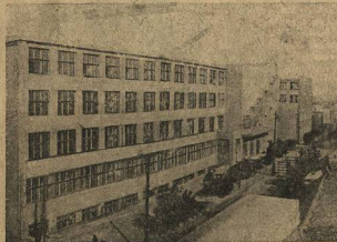
Новое здание Донецкого горного, о котором мы говорим сегодня, и к-т об одном из лучших