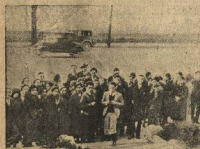
Губернатор Кентукки заявил студентам, что он их не приглашал. Губернатор Теннесси разрешил делегатам посетить на закрытые двери его дворца