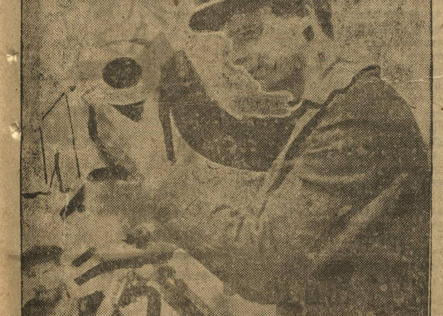
Приступает к работе подшефная редакция „Ленинской Смены“ база кино-аппарата „Союзкино“. Сейчас база готовит специальный фильм и XIV годовщине Октября. О подготовке лентарков в билею звоните по телефону 34-83. Для того, чтобы наиболее интересно из них могли быть записаны, НА СНИМКЕ: оператор Э.И.В. во время съемки на автозаводе.