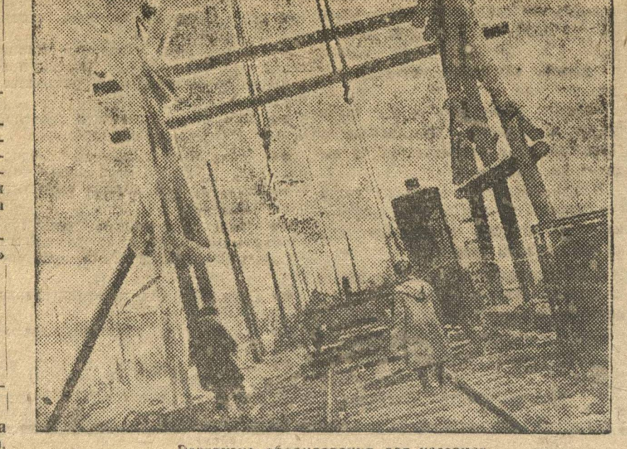
Разгрузка оборудования для кессонов.