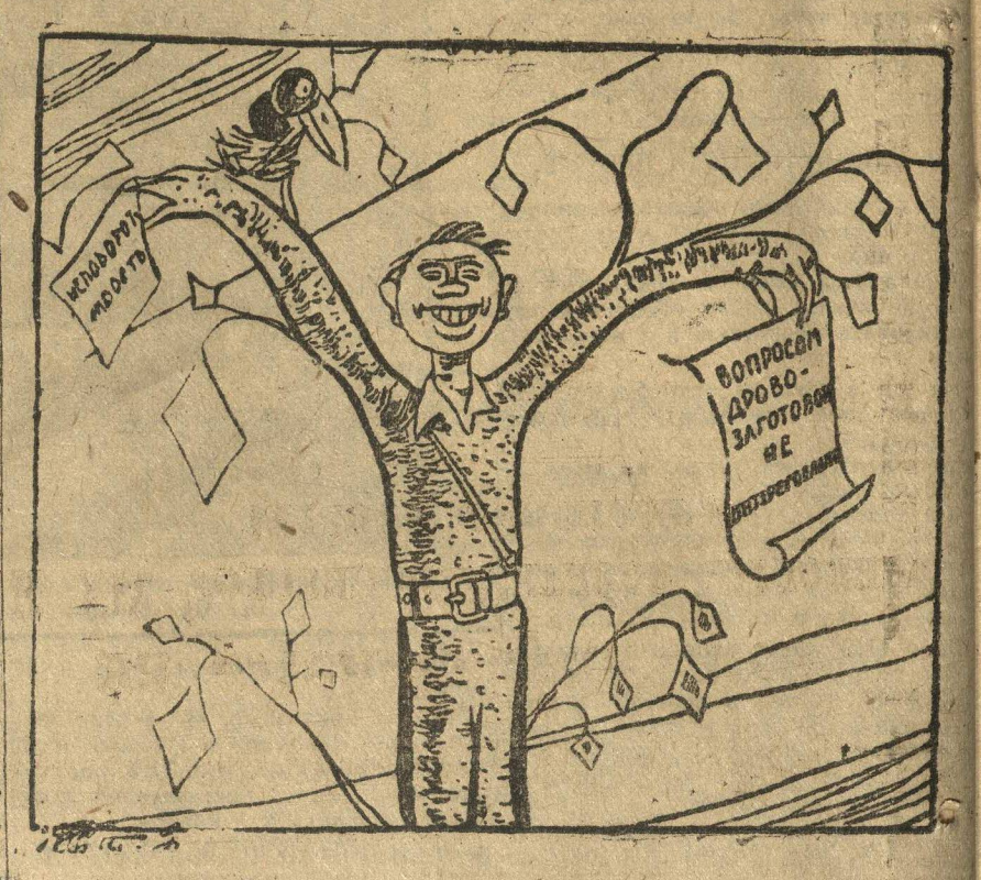
Рис. Гр. Ст.

Выдвинуть из числа постоянных кадров рабочих 15 чел. на работу в существующие бараки.