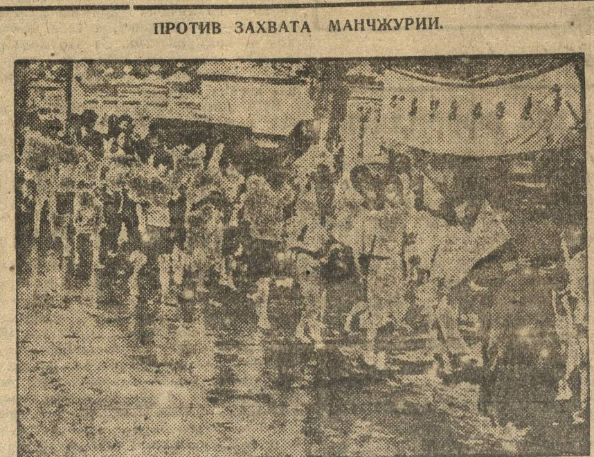
Несмотря на запрещение китайского правительства антияпонского движения в Китае стихийно происходит антияпонские демонстрации...