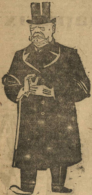
ГИНДЕНБУРГ, ведущий Германию к открытой фашистской диктатуре.