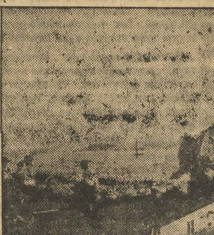
В октябре американская армия обогатилась новыми орудиями истребления людей. На снимке: новая американская пушка в действии.

Мунден, 29. По сообщению военных кругов произошли 3 столкновения между японскими войсками и китайскими «бандитами» в районе железнодорожной линии Чженцзятунь-Синпинган. Китайские войска потеряли убитыми 180 солдат. С японской стороны потерь нет. Сообщают также, что 2000 убожавших китайских солдат, переправившихся через