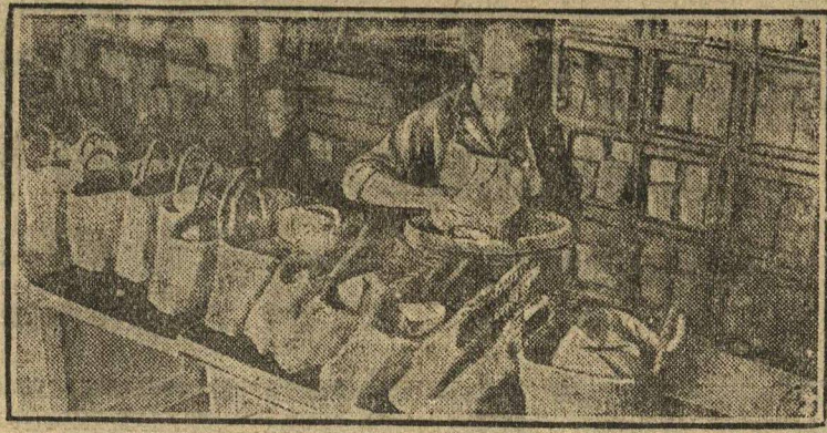
Закрытый распределитель Трехгорной мануфактуры в Москве. В связи с пятидневной проверки работы потребкооперации, стал перестраивать свою работу по-новому, рационализировал отдельные процессы работы. НА СНИМКЕ: продавец-ударник за раскладкой продуктов заказчиков по корзинам.