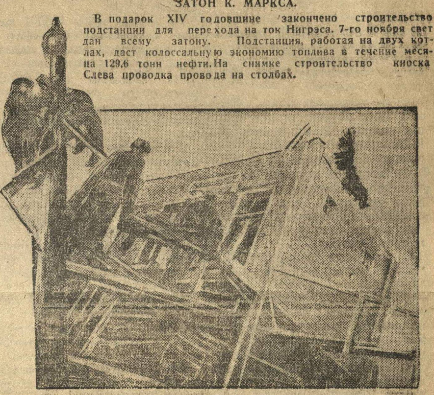
В подарок XIV годовщине закончено строительство подстанции для перезда на ток Нигрса. 7-го ноября свет дал всему району. Подстанция, работающая на двух котлах, даст колоссальную экономию топлива в течение месяца на 12,6 тонн нефти. На снимке строительство киоска Слева проводка проведена на столбах.

Комсомольский финансовый актив не развернул массовую работу по мобилизации полностью рабочую сберкассу-слет райкома ВЛКСМ и районной газеты «Ленинская Смена».