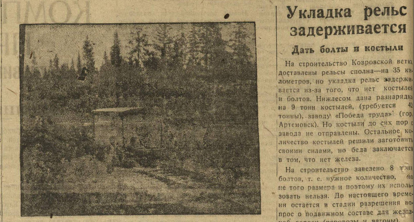
На железнодорожной ветке Яр—Фосфориты.

КОМСОМОЛЫЦЫ СЕМЕНОВА, БОРА, БАЛАХНЫ, ГОРОДЦА, — ВЫ ОБЯЗАНЫ ДАТЬ РАБ. СИЛУ