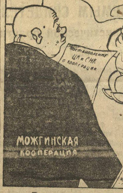
Бурные, продолжительные аплодисменты...

такое же положение и в столовой кооперации — повсюду. Помещение антисанитарного состояния. Вокруг мусора, вонючий воздух. В пищу неоднократно попадались и попадаются волосы, мухи и т. д. На замечания обидчивых официантки отвечают: — Да рази это в первый раз? «Есть захочешь — сешь». Труд в столовых не организован. Сдельщины нет. Официантки нормы выработки не выполняют.