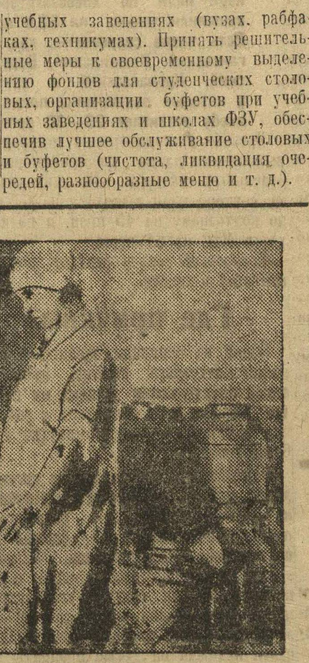
БОГОРОДСК. Прием молока из колхоза на маслозаводе.