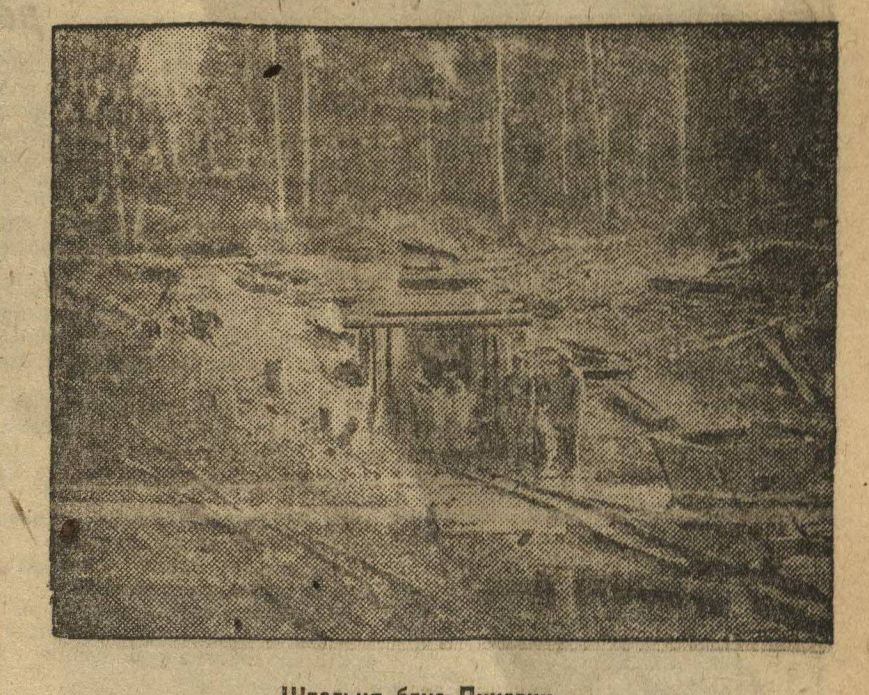
Штольня близ Пинеги