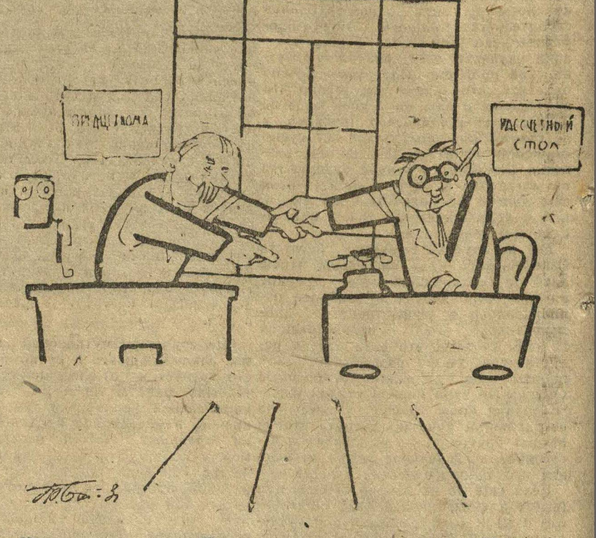
Иван кивает на Петра, а Петр кивает на Ивана...