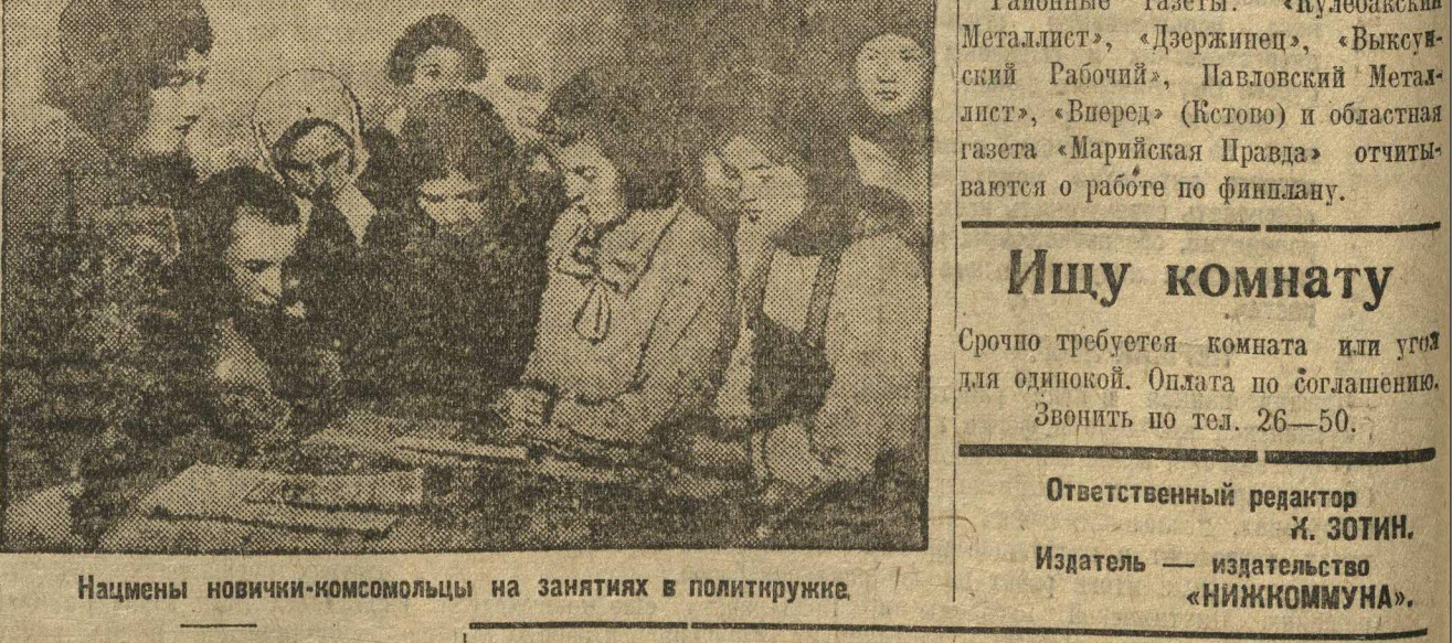
Нацменены новички-комсомольцы на занятиях в политурке