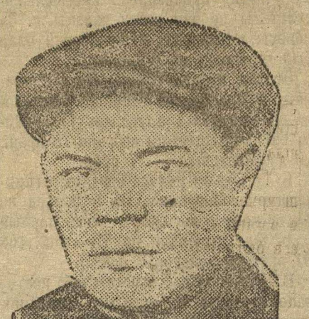
Завод «Красное Сормово».

В-пятых, коренное улучшение работы по реконструкции металлургических заводов. В будущем году надобно обеспечить громадный рост выплавки металла подготовкой к пуску большого количества новых агрегатов.