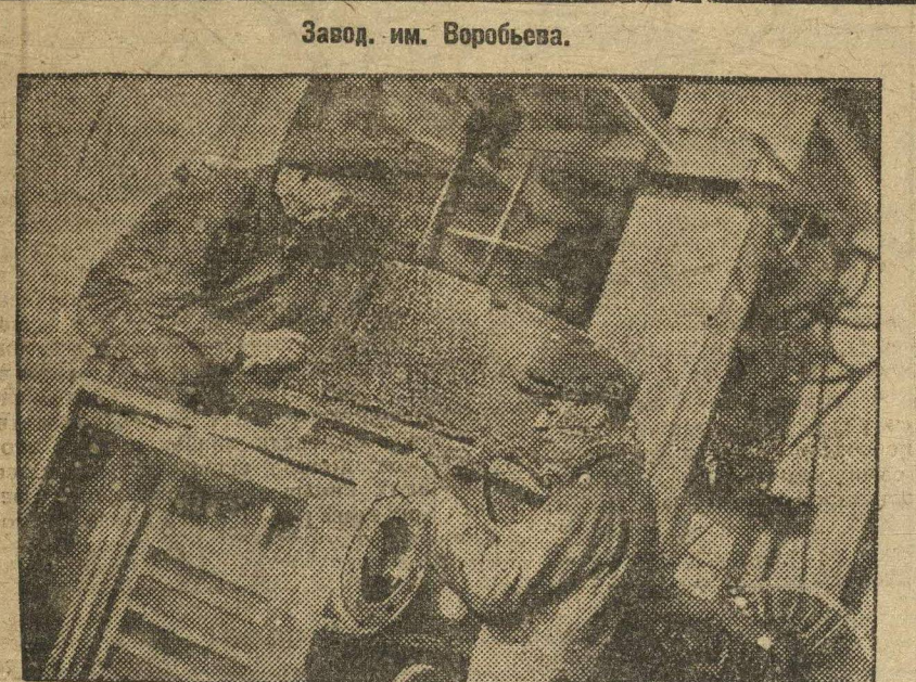
Завод им. Воробьева. Сборка машин комсомольской конструкции.

Итоги сегодняшней радио-передачи будут переданы печати Ивановской области. ТОВ. ВОЛКОВ («ПАВЛОВСКИЙ МЕТАЛИСТ») делится опытом борьбы с оппортунизмом, за систематическое выполнение финплана. «Павловский металлист» вызвал на соревнование «Правду» — Ивановской области. Однако, «Правда» до сих пор на вызов «металлиста» не ответила. Работники и сельхозы включились в активную борьбу за финплан. Мы уверены, что Павловский район на финше эстафеты будет рапортовать о победах. ГАЗЕТА «ВПЕРЕД», КСТОВСКОГО РАЙОНА, сыграла и играет большую роль в достижении побед. Газета провела 9 кулуарных собраний сельхозов, организовала 4 стези и провела ряд сельхозных рейдов. Газета объявлен конкурс на лучшую стенгазету по освещению вопросов финплана. На основе решений I краевого финансового совещания, «КУЛЕБАКСКИЙ МЕТАЛИСТ» перестроил свою работу. «Кулебацкий металлист» под руководством райкома партии, добился выполнения и перевыполнения встречного плана. К 7 ноября квартальное задание было выполнено