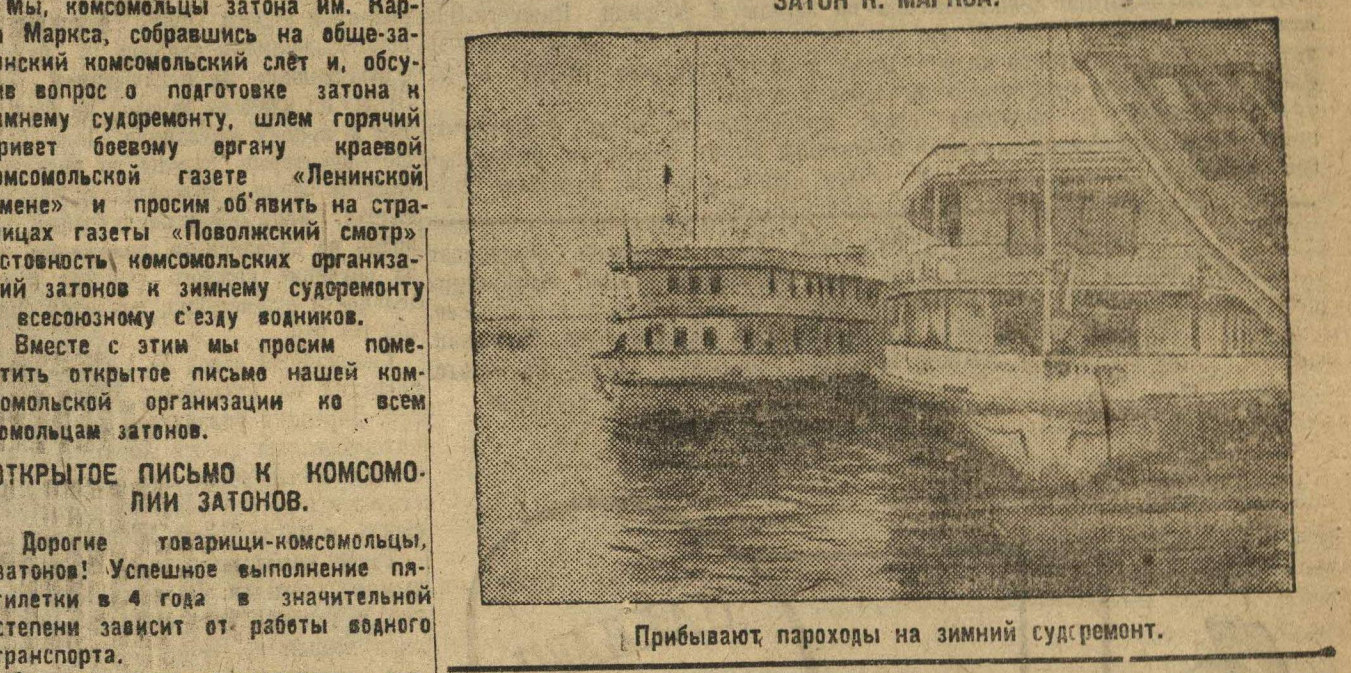
Прибыли пароходы на зимний судоремонт.

Затоны, принимайте вызов карлмарксовцев о поволжском смотре готовности комсомола к зимнему судоремонту! Ударной борьбой за выполнение указаний тов. Сталина поможем партии ликвидировать отставание речного транспорта