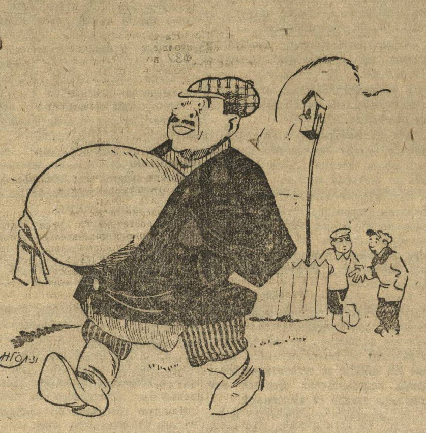
Рис. Н. Головина

Некоторые руководители колхозов утаивают хлебные запасы и не выполняют план хлебозаготовок.