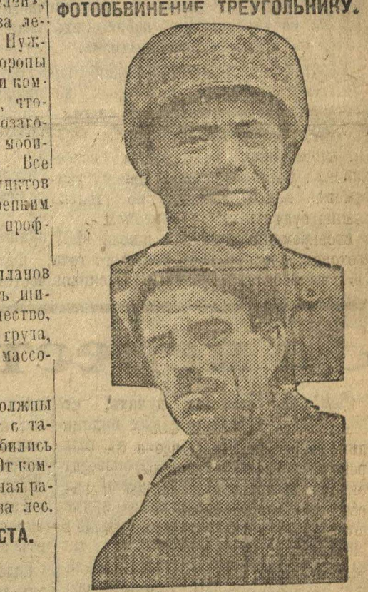
ФОТООБВИНЕНИЕ ТРЕУГОЛЬНИКУ. Во многих затонах по сей день вопрос о новой реформе оплаты труда не решен — уравниловка не изжила.

В этой подготовке затона к зимнему судоремонту комсомол должен показать, что он и в разрешении этой задачи является лучшим помощником партии и рабочего класса. На основе смотра готовности комсомола к зимнему судоремонту, на основе правильной и четкой расстановки комсомольских сил и проведения в жизнь шести указаний тов. Сталина, мы должны вывести транспорт в шерегуну переловых бойцов за построение социализма в ближайший срок. В вопросе подготовки затона к зимнему судоремонту стоят три основных задачи: 1. Подготовка рабсилы, обеспечение ее жилищем и питанием. 2. Заготовка материалов и инструментов. 3. Внутризатонское планирование. О разрешении этих задач, на основе полного осуществления указаний тов. Сталина, будет зависеть успех зимнего судоремонта и будущей