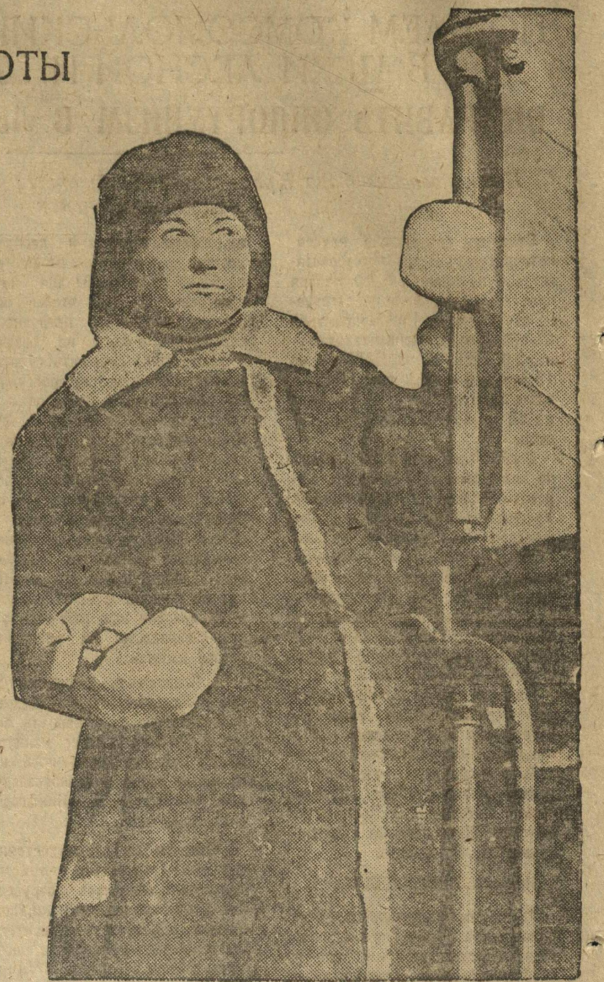
Багиновазжних, комсомолка МИСНОМ. Лучшая ударница. Аккуратно занимается политучебой.

Практическим закреплением политучебы на производстве является организация 10 хозяйственных бригад с охватом 124 человек.