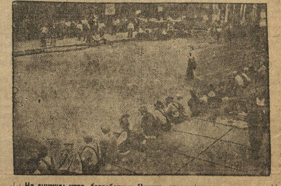
На снимке: учт, безработные Чинга, домогаются выдачи су...