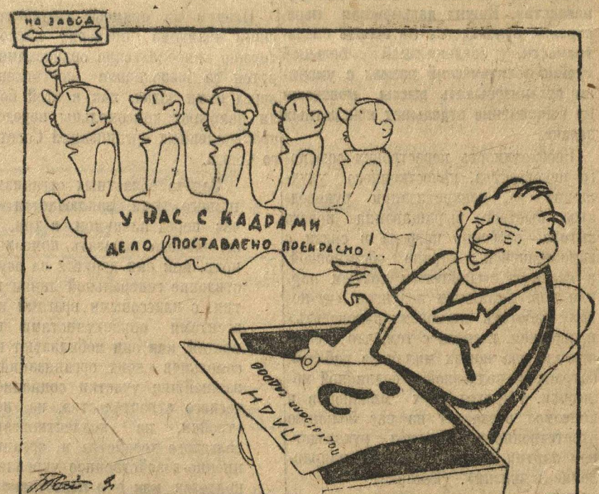
А. Скоро сказка сказывается, да не скоро дело делается

На курсах повышения квалификации при Станкозаводе обучаются рабочие-строители, частью пришедшие с заводов, частью из школ ФЗУ. Всего насчитывается 140 человек. Курсы занимают после работы, но вечерам. Они могли бы работать успешно, бесперебойно и вечером, если бы к их работе заводские организации относились более внимательно. Но получается обратное, ибо организации завода не всегда с занятиями курсов считают, назначают свои собрания, не согласуясь с работой курсов. В результате такого отношения, нередко занятия курсов срываются; бываю вынужденные пропускать со стороны учащихся и проч. Нужно заводскому коллективу комсомола взять под непосредственное наблюдение работу курсов, обеспечить им правильную работу.