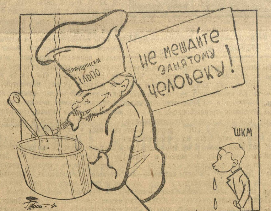
пбтание учеников ШКМ Чернушинским селцо

В Чернушинской ШКМ (Арзамас) до сих пор нет столовой. Несмотря на настойчивые, неоднократные просьбы ШКМ правления сельцо совершенно не идет навстречу школе в организации столовой. Многие учащиеся бегут из школы.