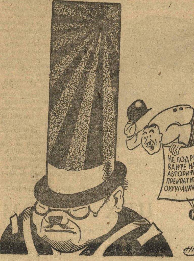
Лига Наций «требует»