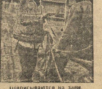
Подписываются на заем.

На рух вон плохо поставлен учет. Комсомолы Б. Полянской ячейки должны отказаться от безалаберного учета, должны покончить с сельсоветской «прикрепленкой».