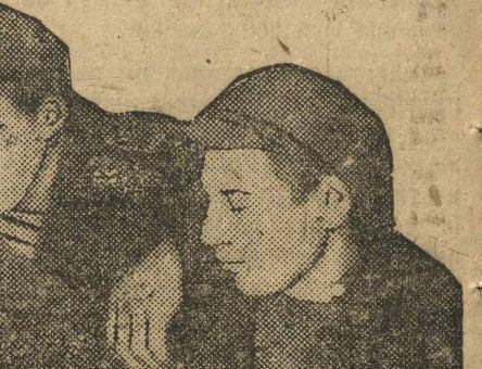
Кумир мирового мещанства должен быть окончательно разоблачен и вынесен с наших экранов молниеносной пролетарской комедии.