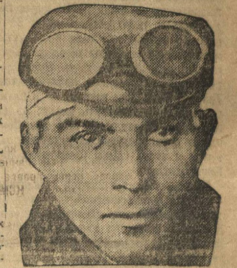
ПЕРВАЯ ДЕТАЛЬ КУЗНИЦЫ АВТОСТРОЯ.

Цеховые организации и штурмовые группы, комсомол, выполняя одно из 6 условий тов. Сталина, должны окружить специальными вниманием и заботой каждого специалиста с поставленными перед ними задачами, и в то же время крепко бить по отдельным грубым настроениям и разгильдяйству их среде. Масса специалистов в ближайшем будущем должна показать образцы, примерами ответственности и героизма.