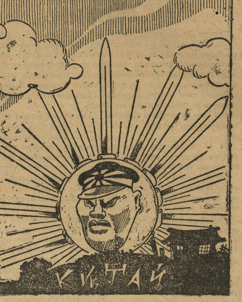
Страна „восходящего“ солнца «Конфликт» углубляется

Манчжурский конфликт стремительно развивается. Атмосферу дружеского созерцания и скрытого содействия Японии со стороны главнейших империалистических стран прервал итерриториальный восток Стиimsona и «гневный протест» английских военных властей по поводу операции оккупантов в районе Байпин-Мукайскай г. л. Разговоры о «высокой миссии» захватчиков по «организации» Китая, «становлении» капиталистической цивилизации на Дальнем Востоке сменились явной торговлей за сферы влияния в колонии империализма всего мира — Китае.