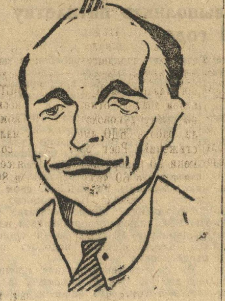
Генеральный секретарь Лиги Наций Эрик Друманон.

ПАРИЖ, 10 декабря. Решение Совета Лиги Наций по манчжурскому вопросу знаменует полную победу не только Японии, но и Франции, которая