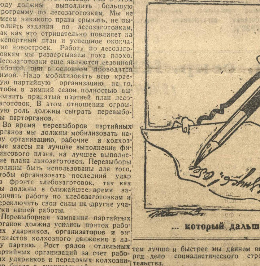
... который дальше своего носа не видит

Вокруг каких задач, в связи с перевыборной кампанией, мы должны мобилизовать нашу партийную организацию и широкие ее слои? Для отдельных партячеек эти задачи различны. Их надо дифференцировать в зависимости от того, какой характер имеет работа ячейки, какой тип ячейки, какой тип партийной организации, какой тип хозяйственной деятельности. Партийные организации востроков должны сейчас все свои силы сосредоточить на уходе за заводами, на создании кадров, на овладении и освоении этими кадрами техники этих предприятий.