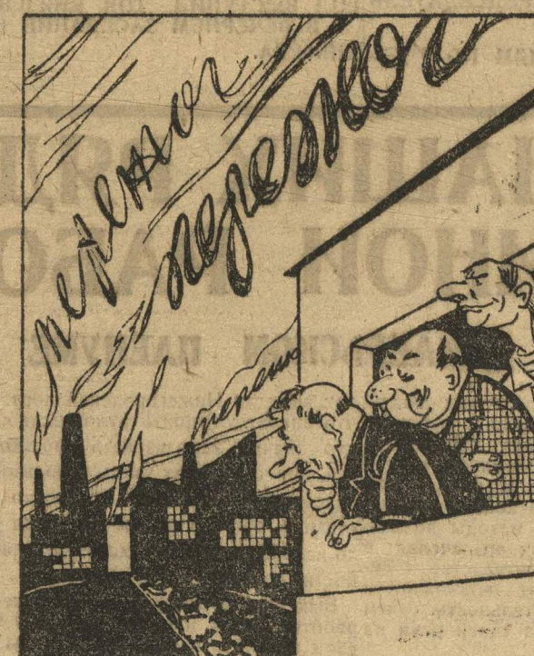
Дым заводской так сладок и приятен...