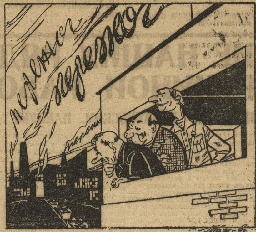
Дым заводской так сладок и приятен...