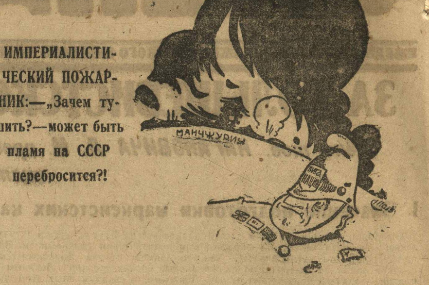
Рис. Н. Головина

Лига Наций, выслушав лицемерные заявления, ничего не предпринимает для прекращения манчжурской авантюры.