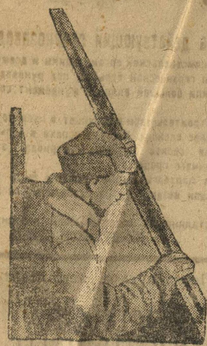
После лыжной вылазки курсант обтирает лыжи.