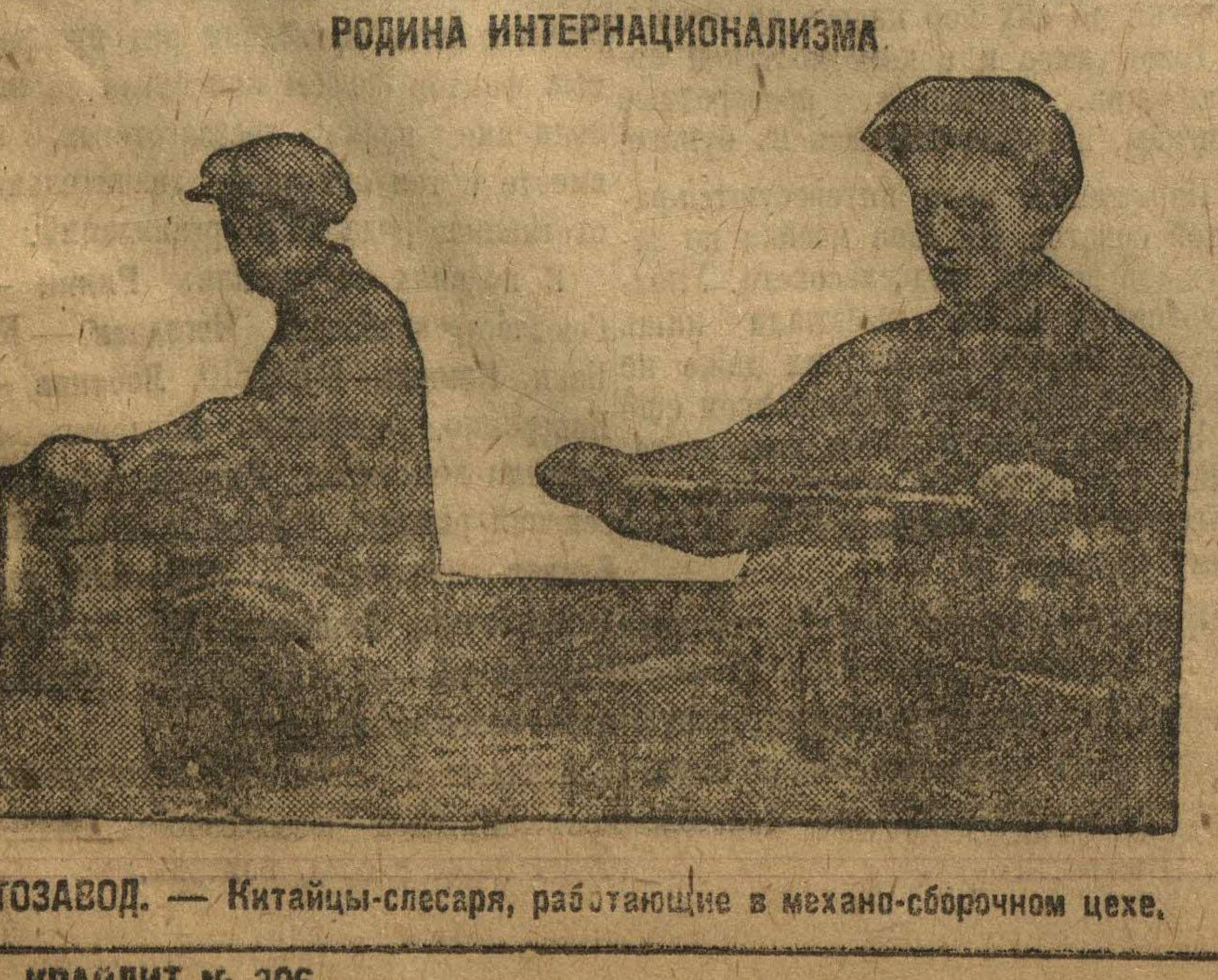
АВТОЗАВОД. — Китайцы-слесари, работающие в механо-сборочном цехе.

29. Для усиления оперативного руководства в НКПС, дирекциях и районных свестках к минимуму практиковать издание приказов и самых их объем.