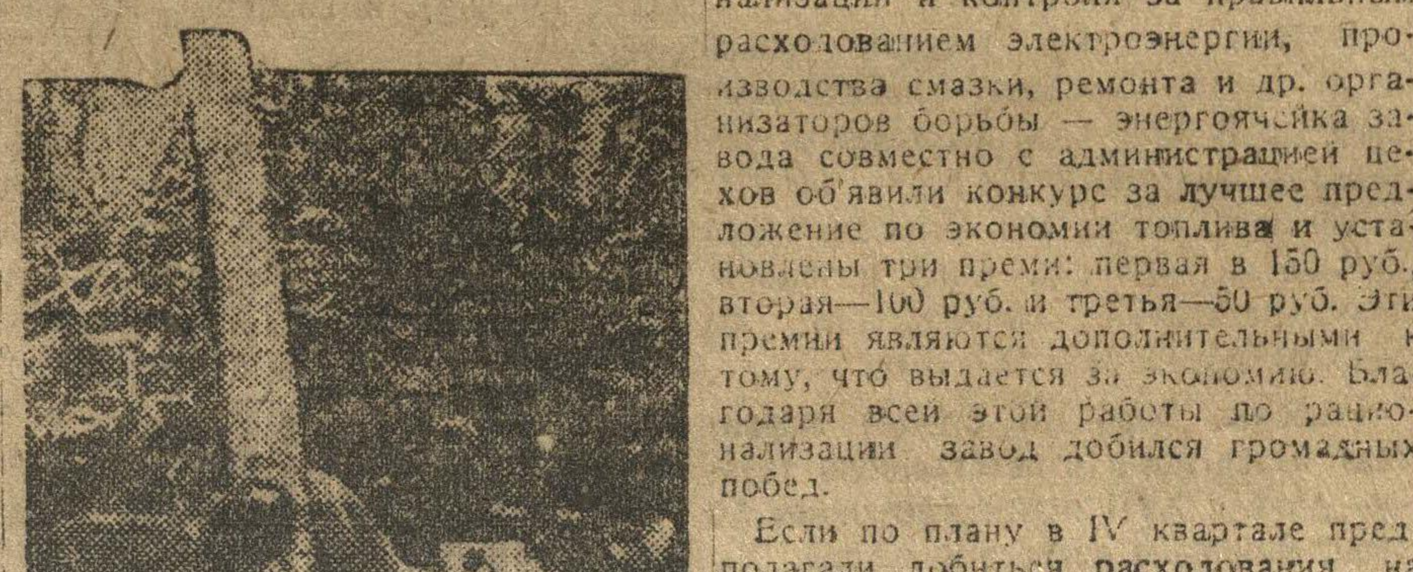
Учпромхоз «Обход», Уреньского леспромхоза. Комсомольская бригада валит дерево.

Если по плану в IV квартале предполагали добиться расходования на 1 кв. час до 330 грамм топлива, то теперь на 1 киловатт час расходуются 307 грамм и меньше.