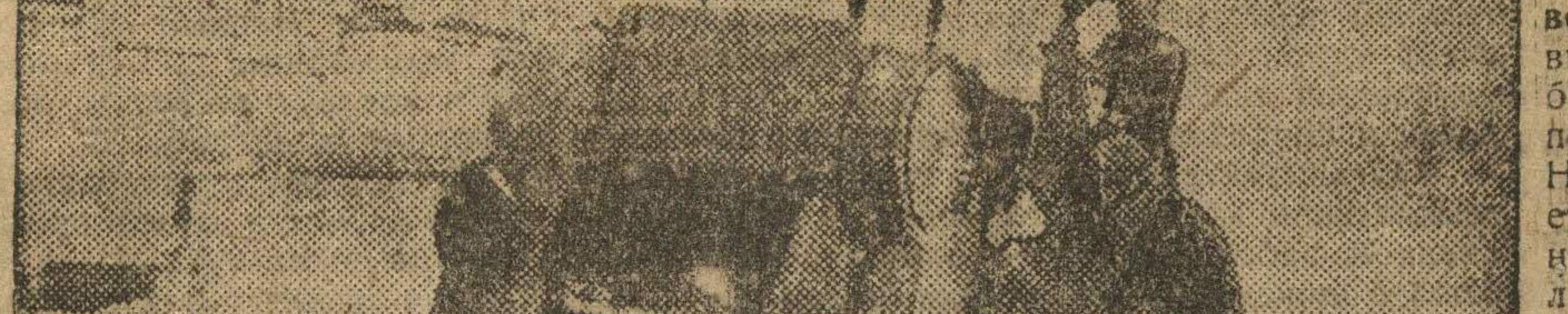
Уреньский леспронхоз «Обхоз». «Интернационал» готовится на возку древесины.