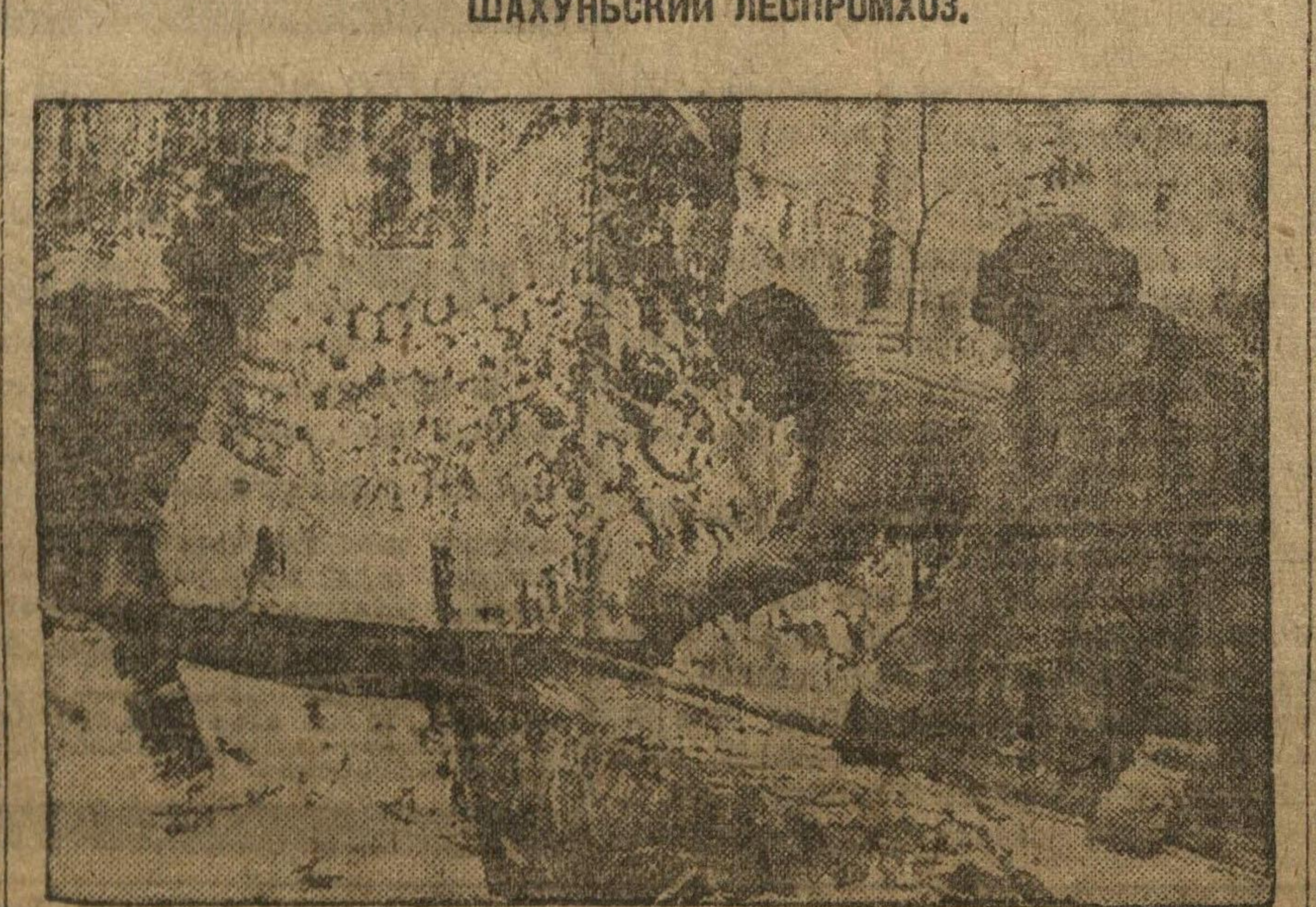
Колхозники Арбурского колхоза (Татрепублика) заготавливают дрова и строительный лес.