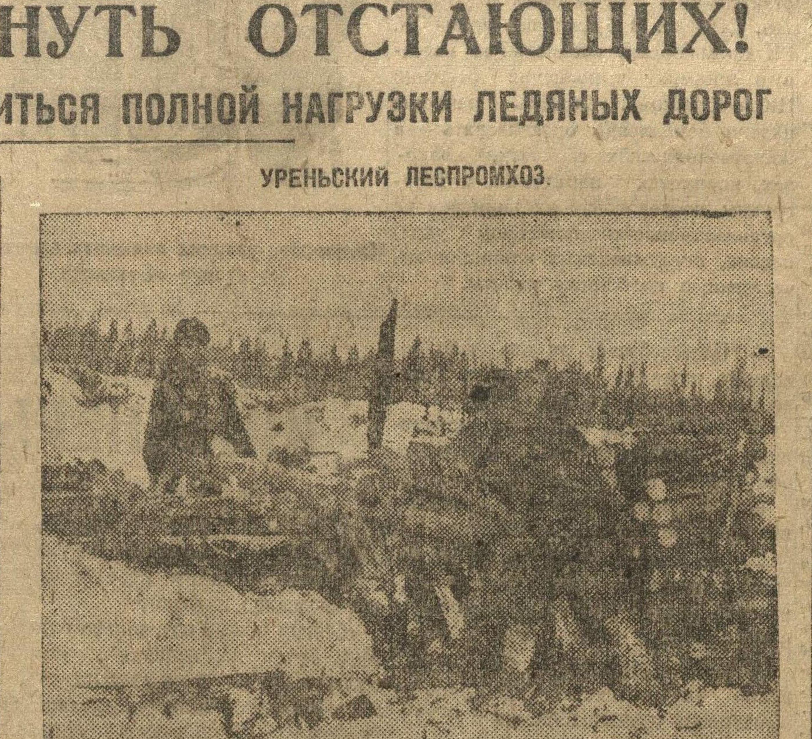
Ударная бригада комсомольцев за пилой дров.