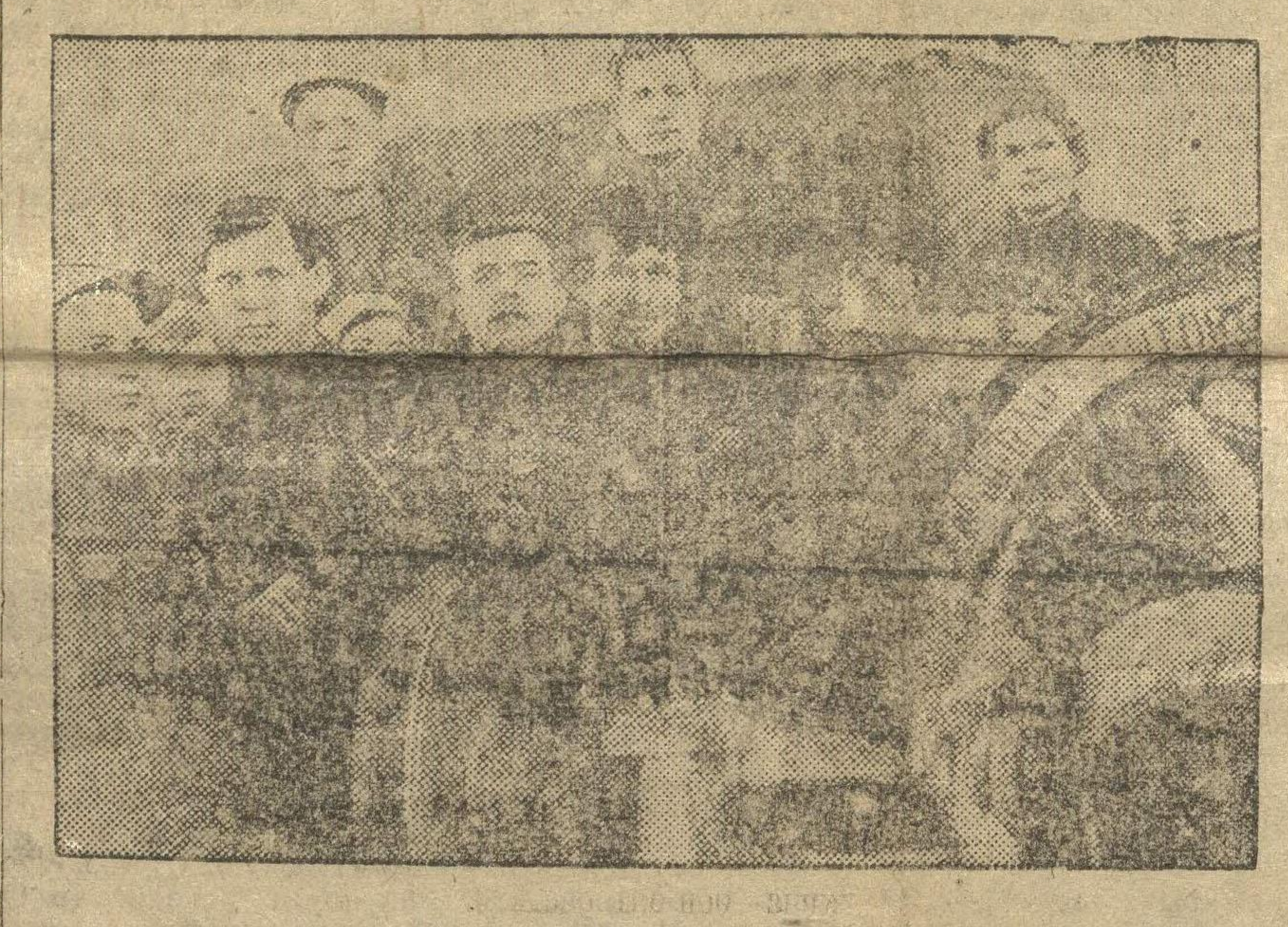
АВТОЗАВОД. (Рессорный цех). Комсомольская бригада заготовителей.

Важнейшим делом в работе комсомольской организации является создание массовой ударной литературы, комсомольская организация МАО не подготовилась.