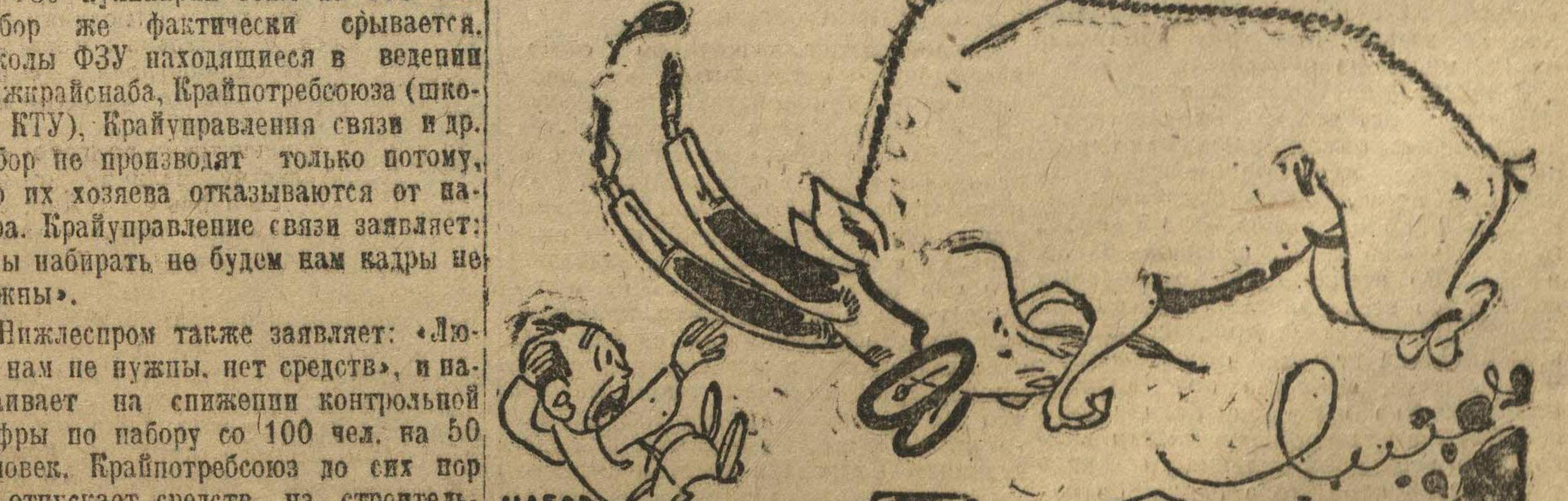
Рис. Гр. Ст.

План для организаций, как например Крайвель, Леспром, Советторф и др. от февральского набора в ФЗУ отказываются, заявляя, что им кадры не нужны.