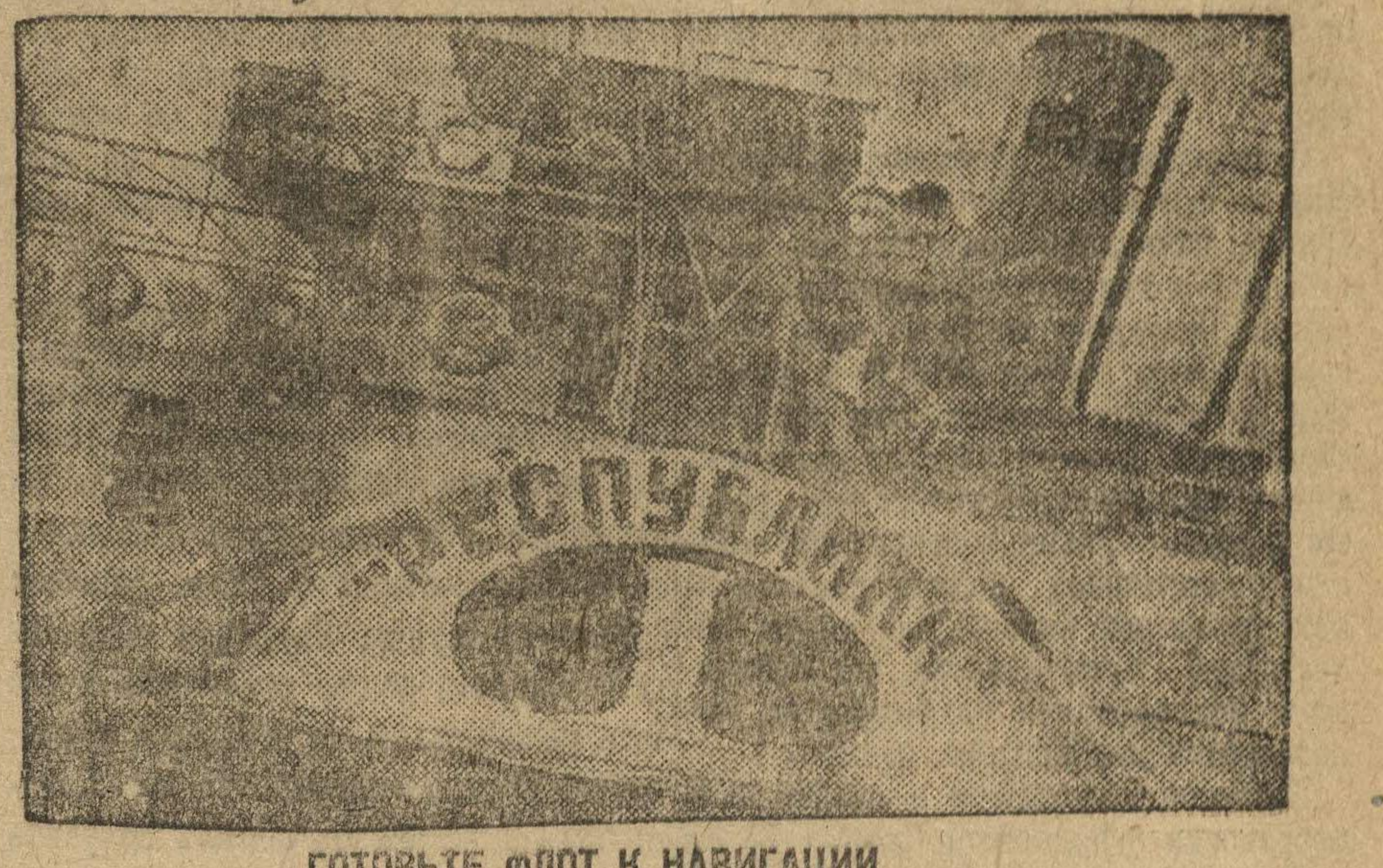
Готовьте флот к навигации.

Целью не отметить косность в изготовлении механизации со стороны