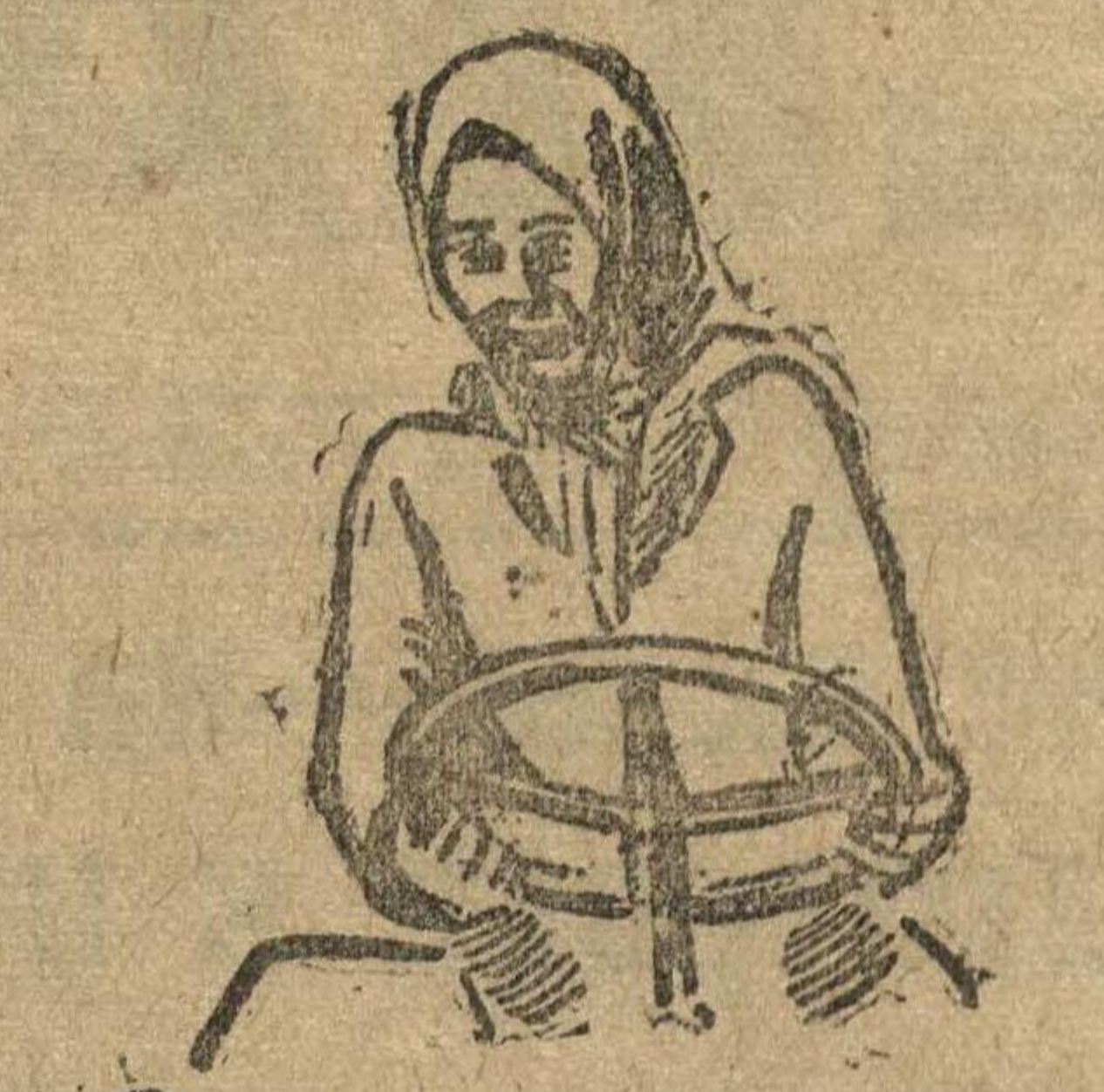
За кадры социалистических полей!

В Соргачском районе подготовка к весенне-посевной кампании развертывается по-новому. Доведение плановых сева до каждого двора в основном закончено. В колхозах заканчивается составление финансово-производственных планов. На 15 февраля сортирование семян произведено на 76 процентов. Связка семян по колхозам закончена на 100 проц., по единичному сектору на 60 проц. и страховых на 60 проц.