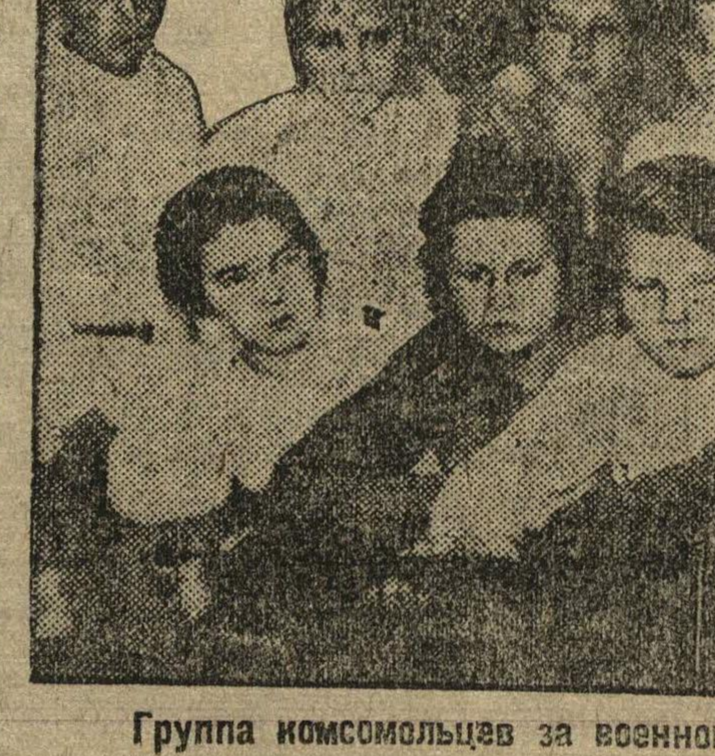
Группа комсомольцев за военной учебой (разбирают винтовку)