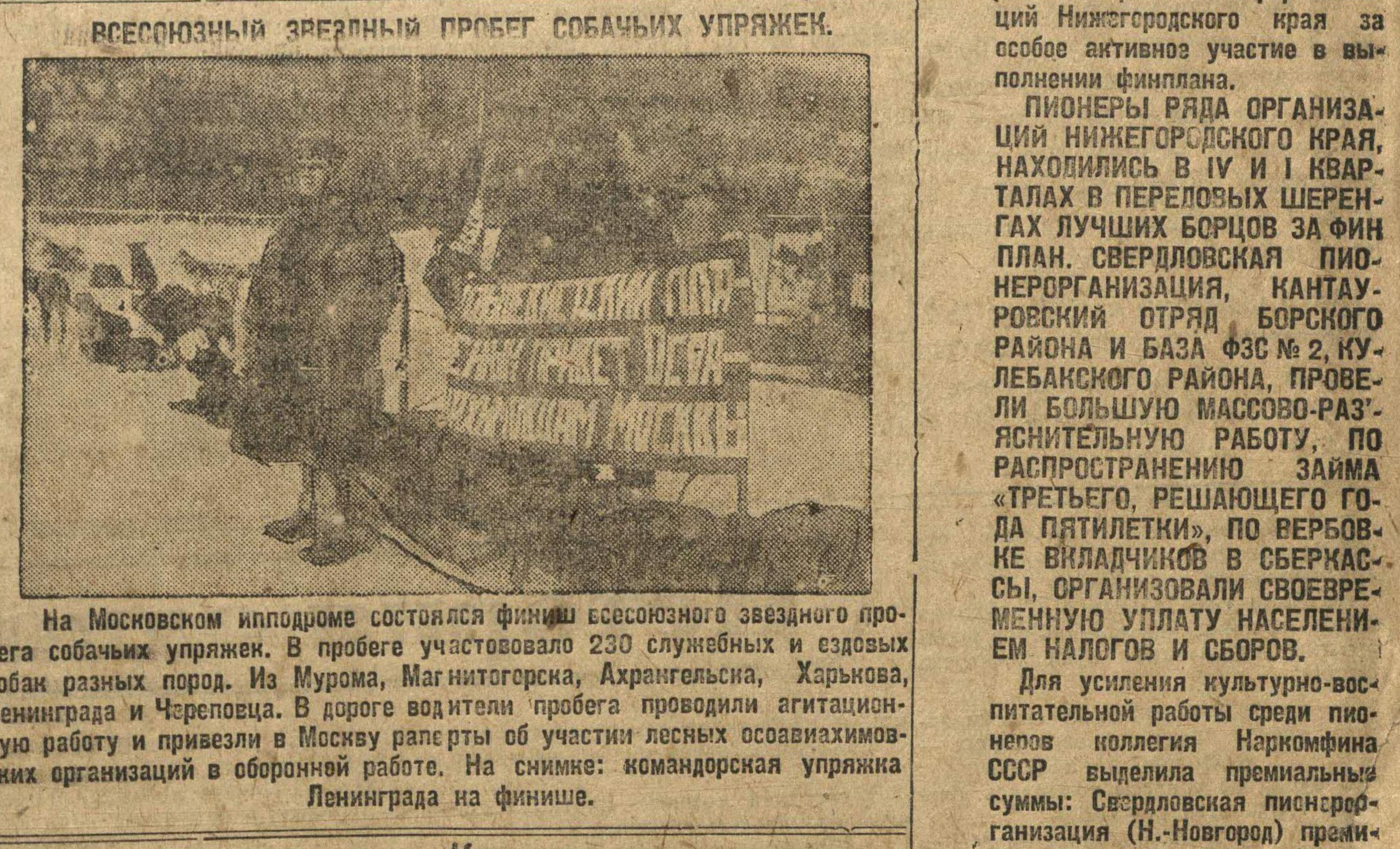
ВСЕСОЮЗНЫЙ ЗВЕЗДНЫЙ ПРОБЕГ СОБАЧИХ УПРЯЖЕК.

На Московском ипподроме состоялся финиш всесоюзного звездного пробега собак упряжек. В пробега участвовало 230 служебных и ездовых собак разных пород. Из Муромы, Магнитогорска, Ахтарьинска, Харинова, Ленинграда и Череповца. В дороге водители пробега проводили агитационную работу и привезли в Москву вапеты об участии лесных охотничьих организаций в оборонной работе. На снимке: командорская упряжка Ленинграда на финише.