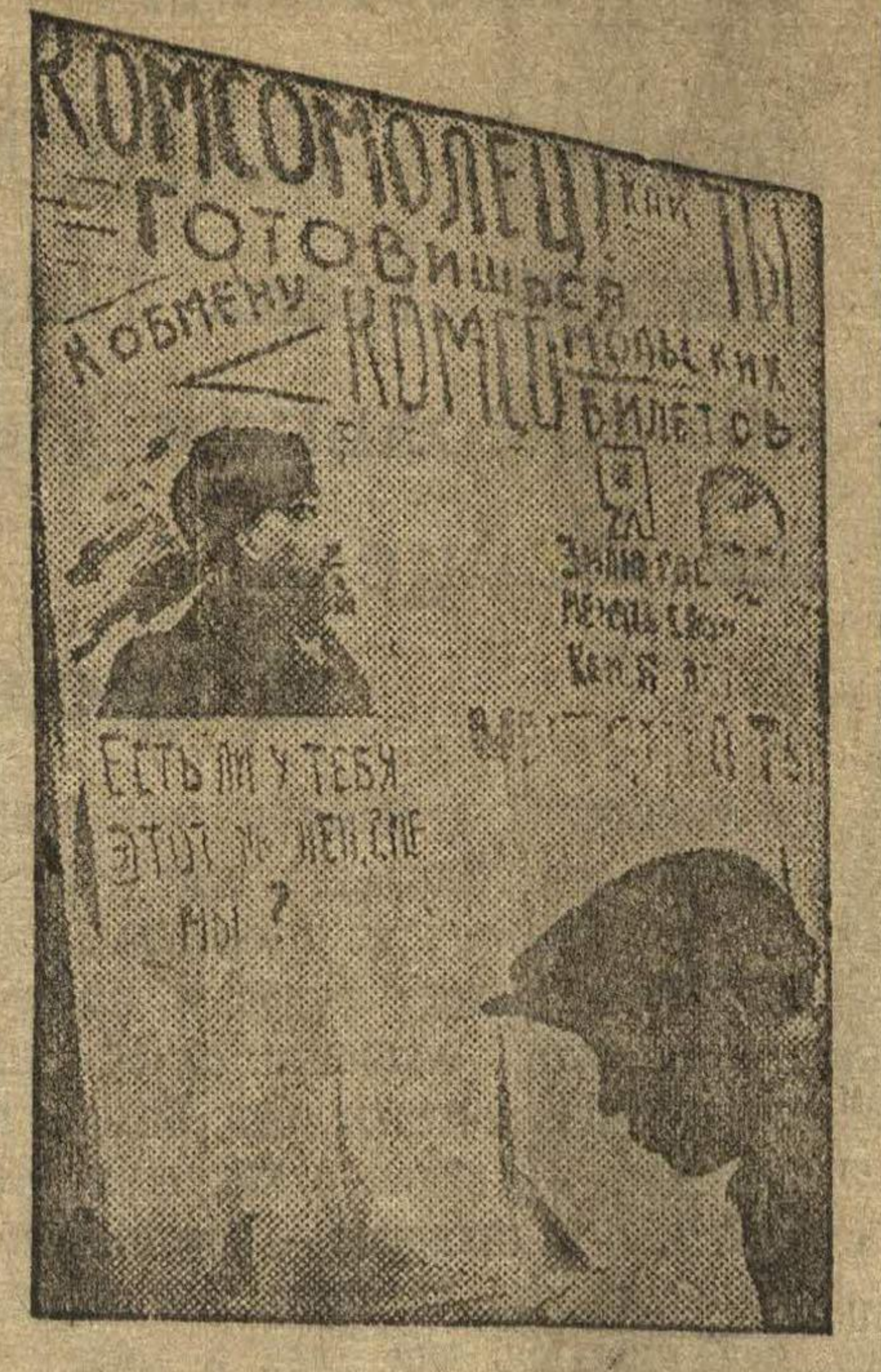
Комсомольский бюллетень, выпущенный к обмену РСМ билета (завод «Красная Этна»).

В последние дни первого квартала, комсомолу края необходимо обратить наиболее внимание на отсталые участки практики: заем, культсбер, сберкассы. Здесь нужно добиться