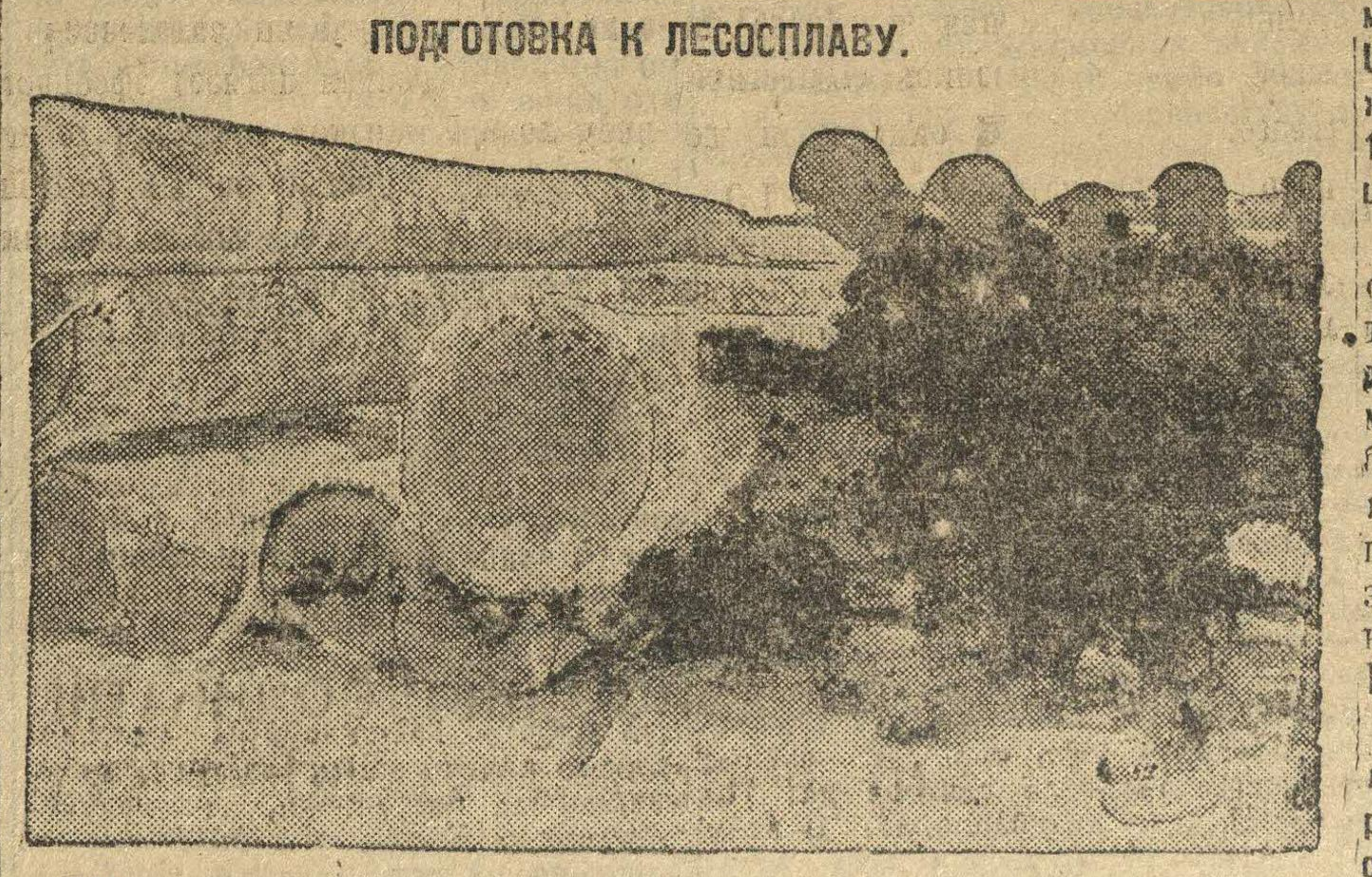
Подготовка к лесосплаву. Началась загрузка леса на Кулиновской тракторной базе. Кат ласского леспротеха (Натице, «Слудия» на р. Уфного). В первую очередь плотится лучшая элитная нагбална.