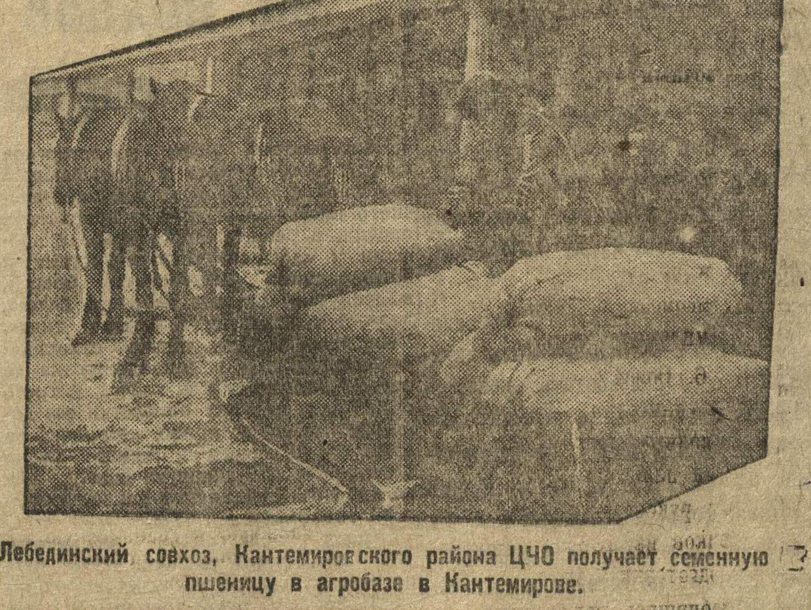
Лебедянский совхоз, Кантемировского района ЦЧО получает семенную пшеницу в агробазе в Кантемирове.

Кинуринская организация комсомола должна это учесть и своевременно ударить по таким фактам.