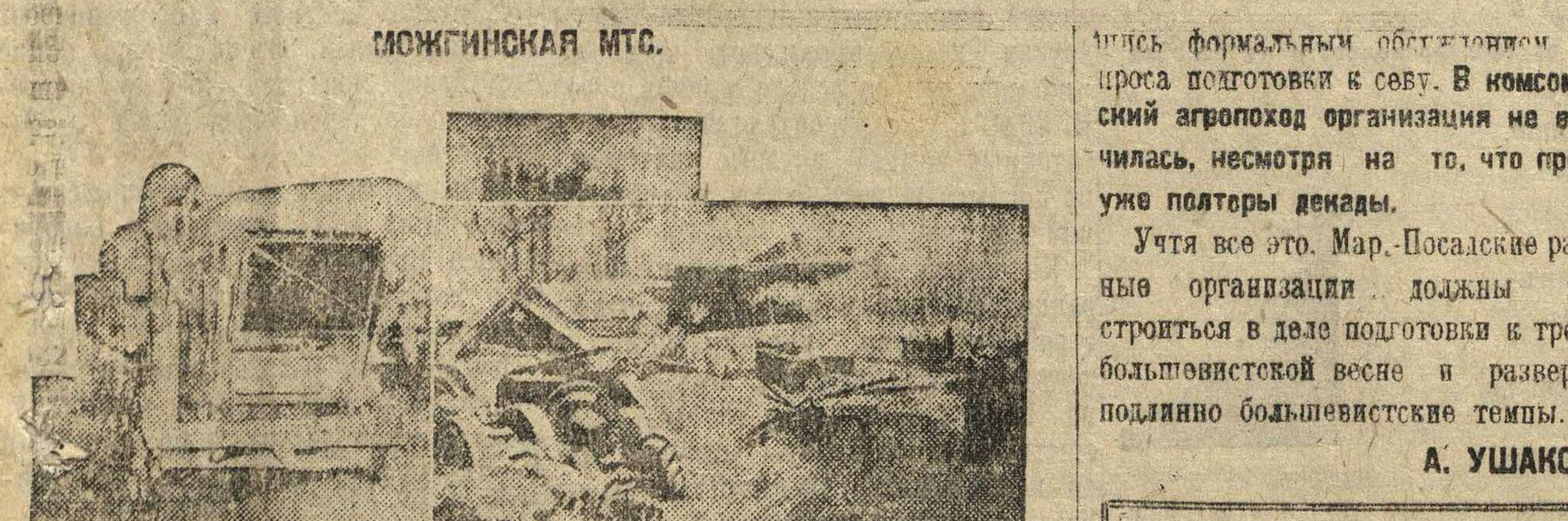
Безобразнейшее отношение к сельскохозяйственному инвентарю. Слева: сломанная молотилка стоит в снегу. Правая: общий вид разбросанного по снегу инвентаря.