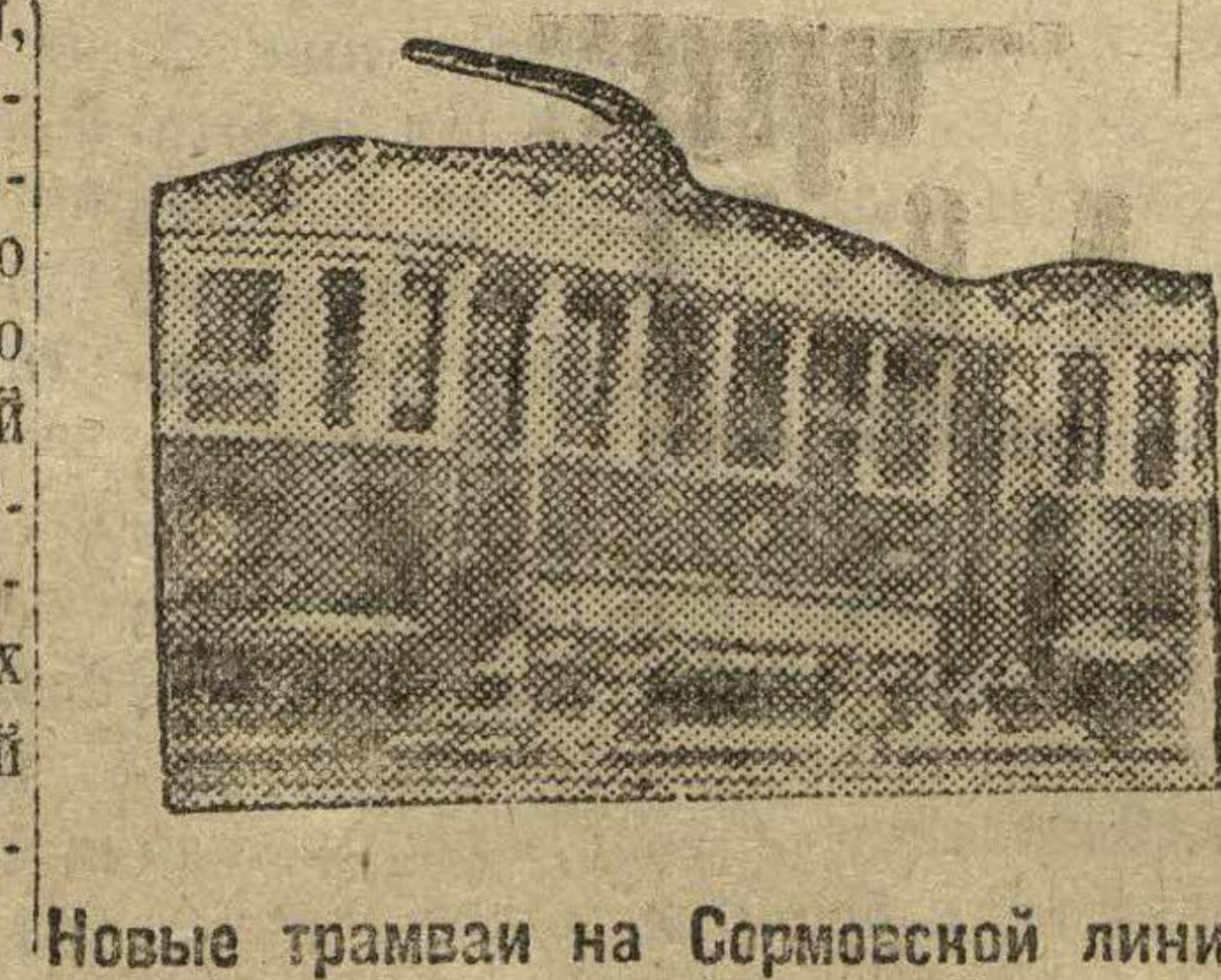
Новые трамваи на Серовской линии.

Этот ценнейший для строительства материал до сих пор считается отходом производства, обузой, в то время, когда шлак имеет все права на существование, как товарная продукция, при условии, конечно, должного за ним ухода.