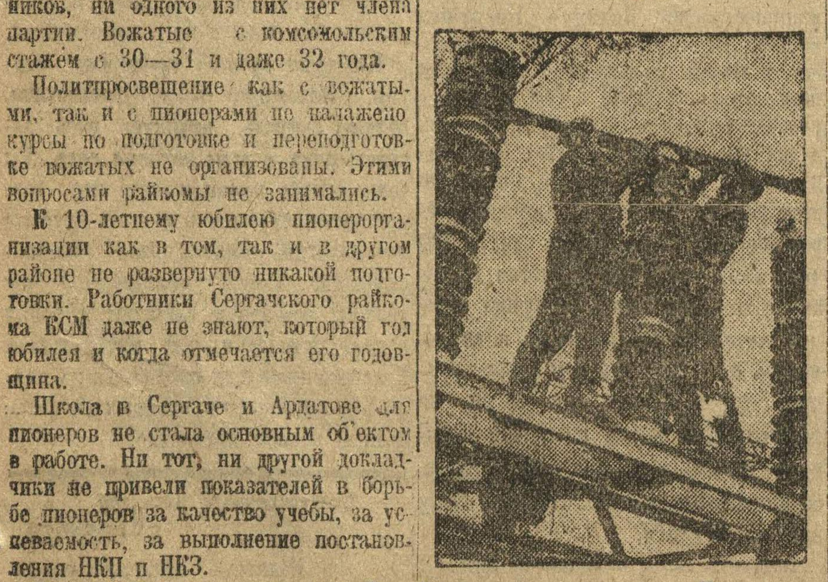
На Днепрострое накануне 1 мая