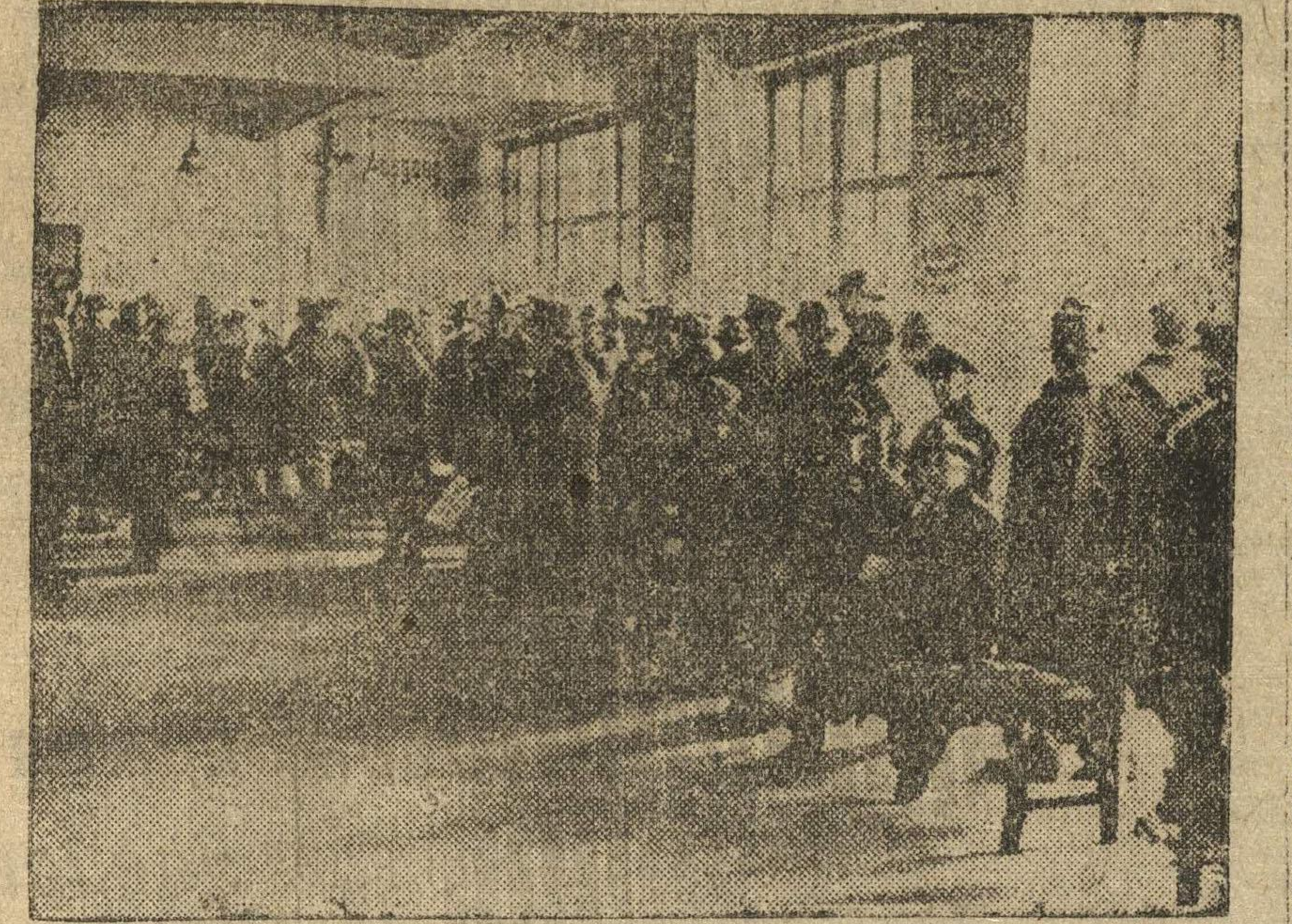
На снимке: Берлинская биржа труда для квалифицированных рабочих. Здесь бесцельно проводят свои дни безработные.