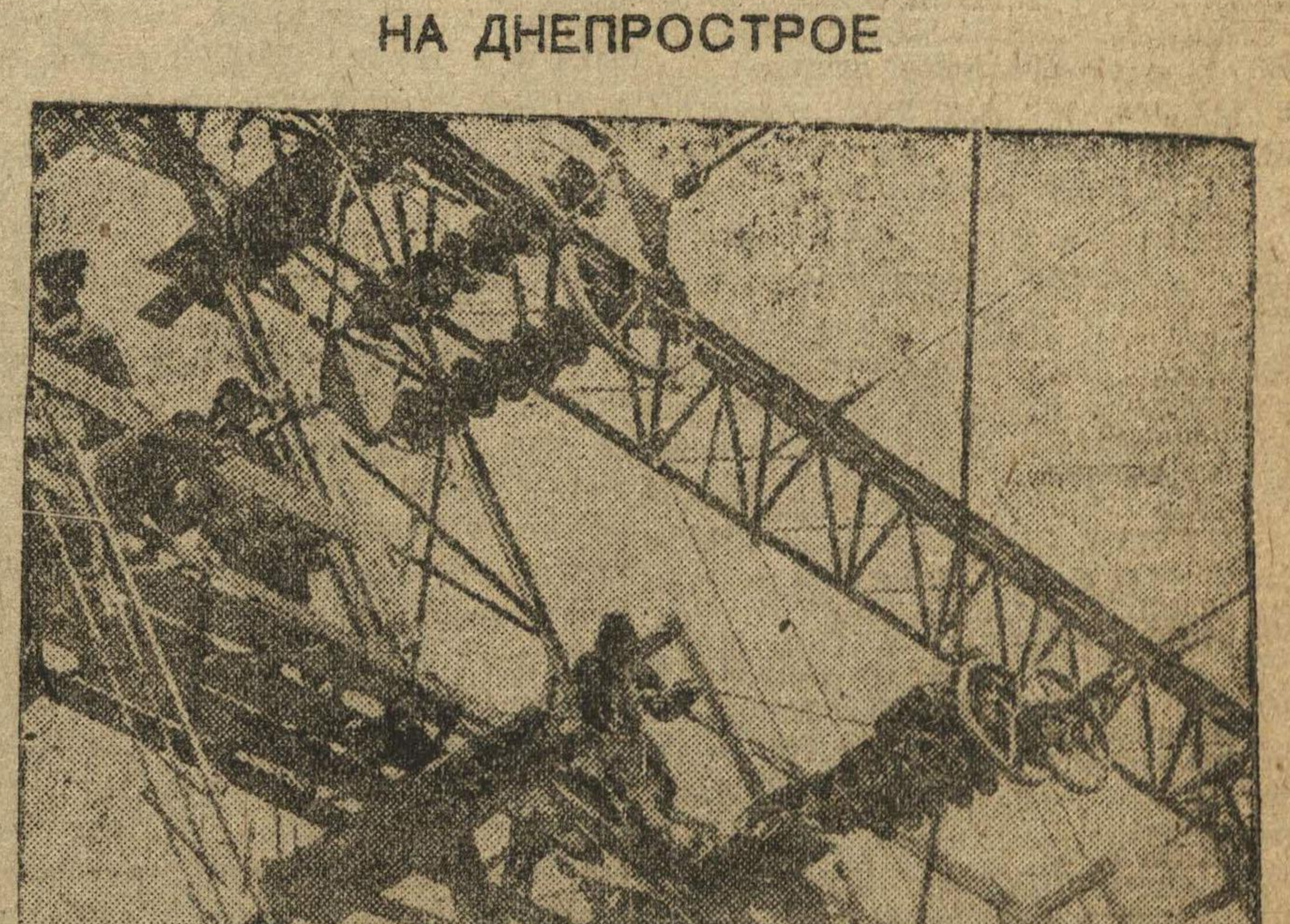
Монтаж гир. на на электростанции.

На снимке: комсомольцы Пожидаев и Подняков монтируют заземлительный столбик.