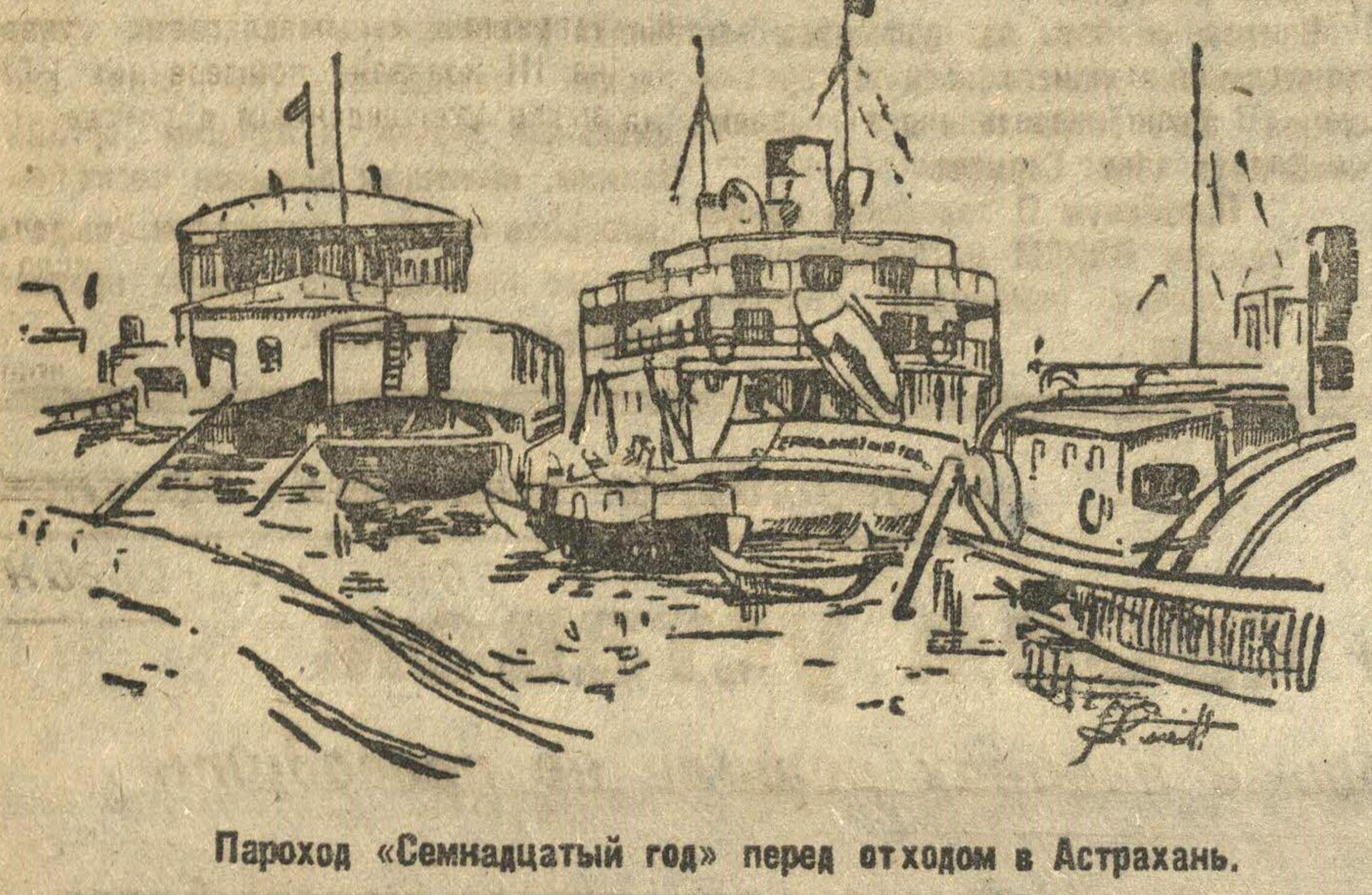
Пароход «Семнадцатый год» перед отходом в Астрахань.