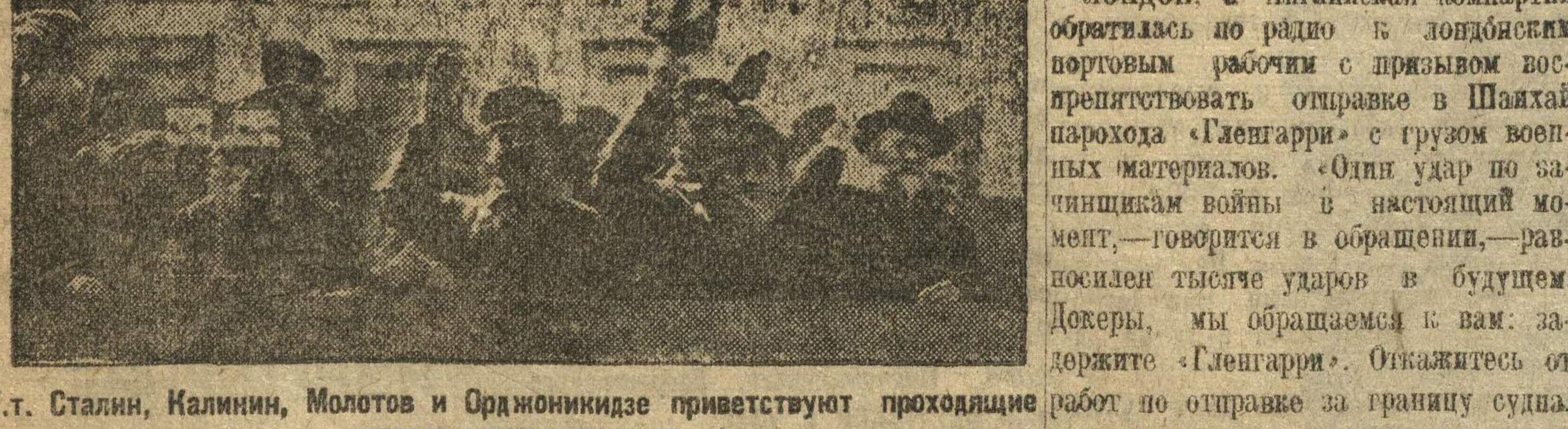
Т.т. Сталин, Калинин, Молотов и Орджоникидзе приветствуют проходящие колонны демонстрантов.