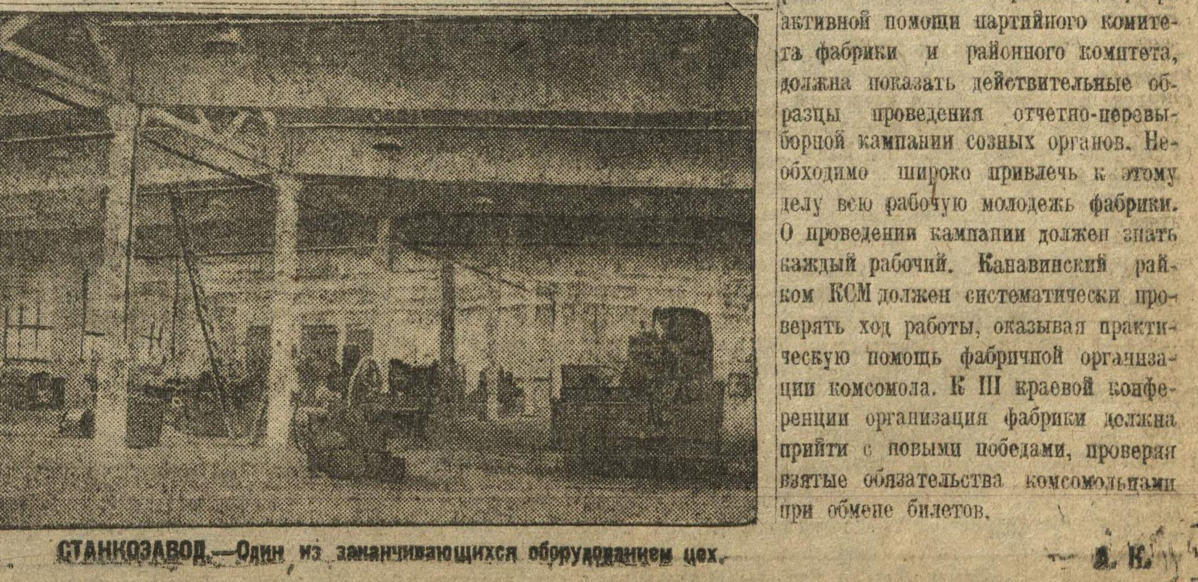
МОСКУТИН. СТАНКОЗАВОД. — Один из замечательнейших образцов современного оборудования.

ЛОНДОН. Английская компания обратилась по радио к лондонским портовым рабочим с призывом воспрепятствовать отправке в Шанхай парохода «Гленгарри» с грузом военных материалов. «Один удар по зачинщикам войны в настоящий момент», — говорится в обращении, — равносителен тысячам ударов в будущем. Докеры, мы обращаемся к вам: держите «Гленгарри». Откажитесь от работ по отправке за границу судна, несущего смерть». Под руководством компартии, состоящий массовый поход к месту стоянки «Гленгарри». Отплытие из лондонского порта в Китай судно «Гленгарри» везет крупный груз синильной кислоты. Полагают, что груз «Гленгарри» также состоит из синильной кислоты и других веществ, употребляемых для производства ядовитых газов.