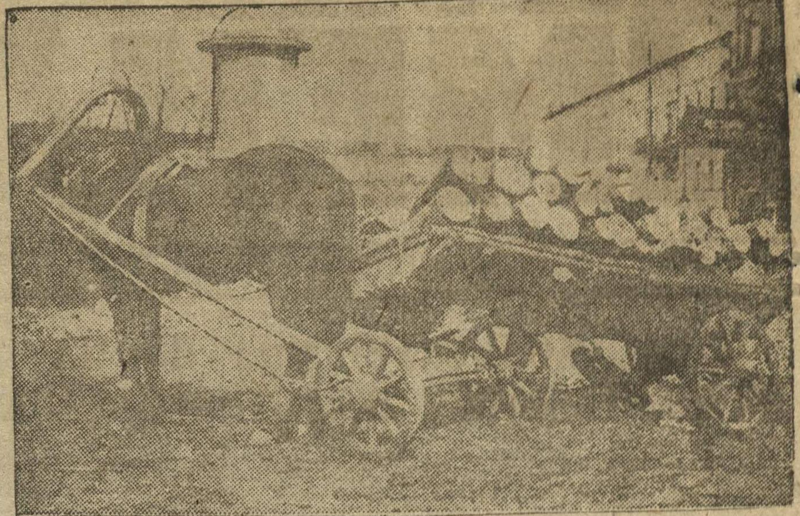
Начались работы по ремонту мостовых. На фото: результат испорченной мостовой в центре города (у гостиницы «Россия»).