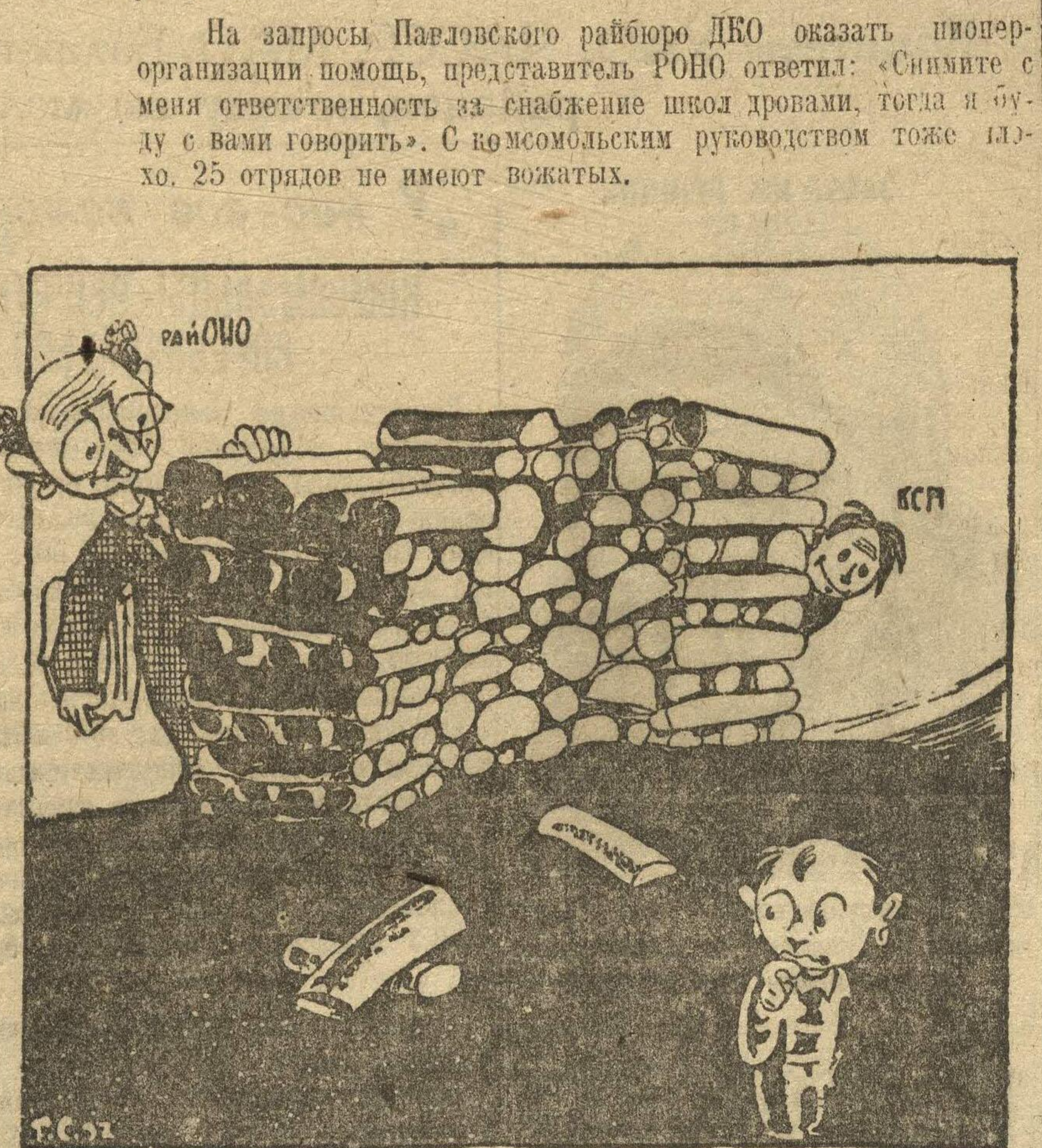
Рис. Гр. Ст.

Проводится пионерский интернациональный конгресс. Пионеры организовали футбольные матчи в целях изучения исторических мест революционных дней Октябрь. Этих результатов пионерорганизация добилась при непосредственной помощи комсомола.