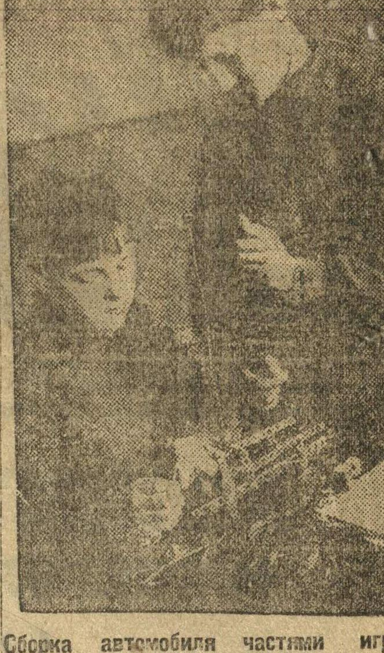
Сборка автомобиля частями игры «Конструктор»