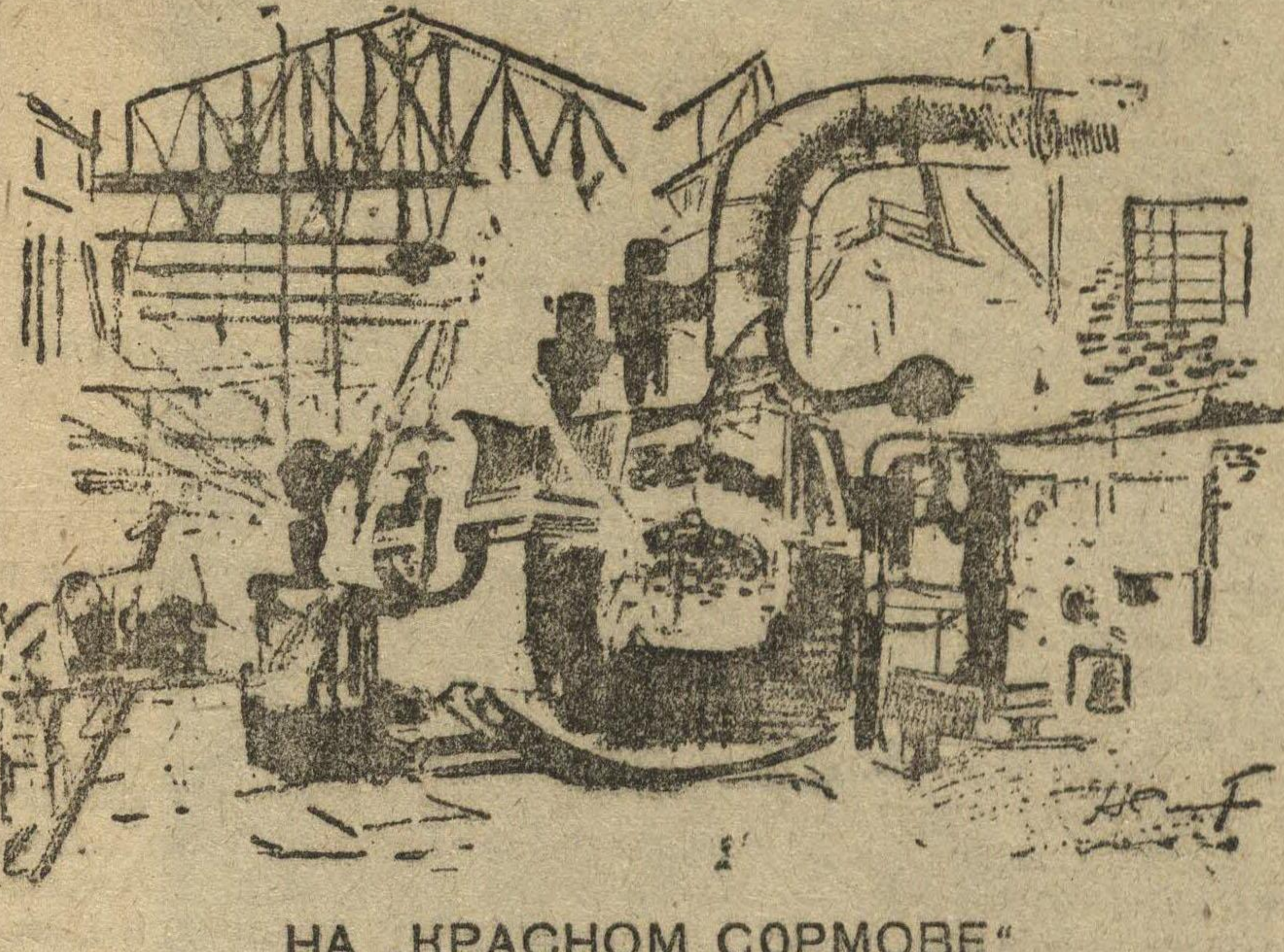
НА «КРАСНОМ СОРМОВЕ»