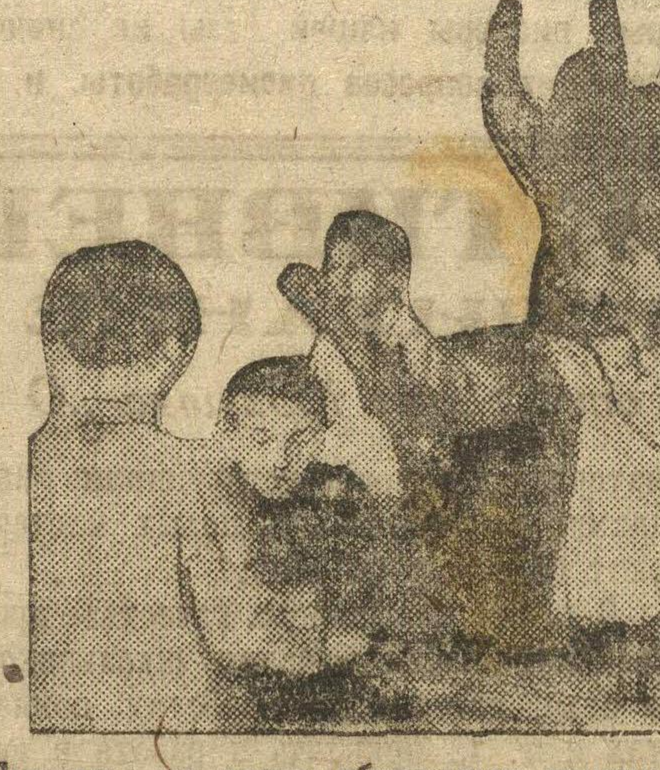
Пионеры на звене обсуждают решения ЦК и Крайкома ВЛКСМ о положении пионерской организации Нижегородского края.