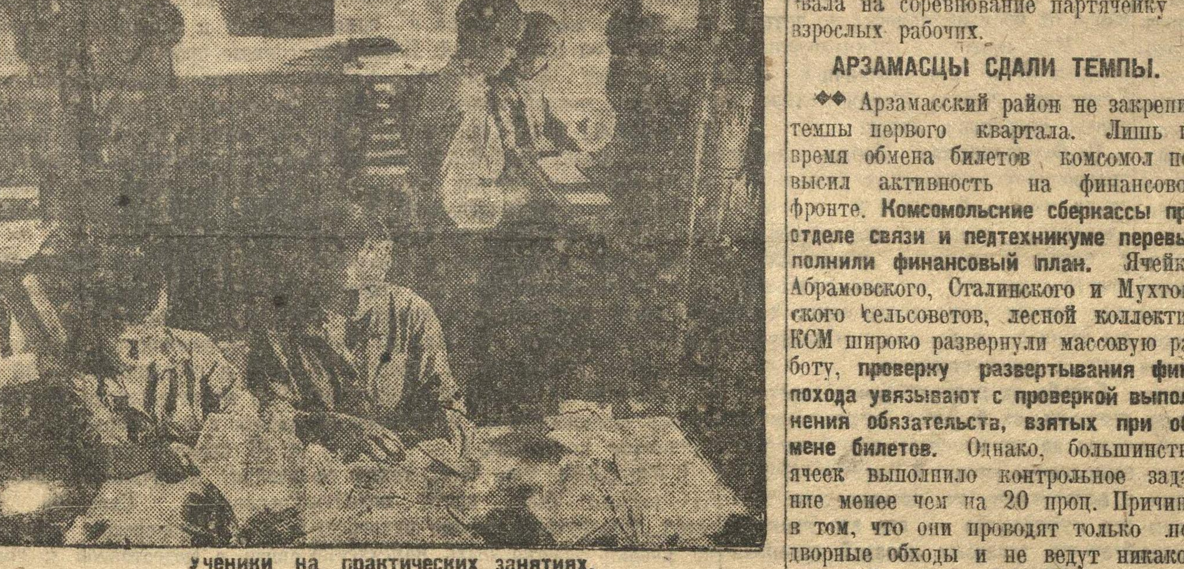
Ученики на практических занятиях.