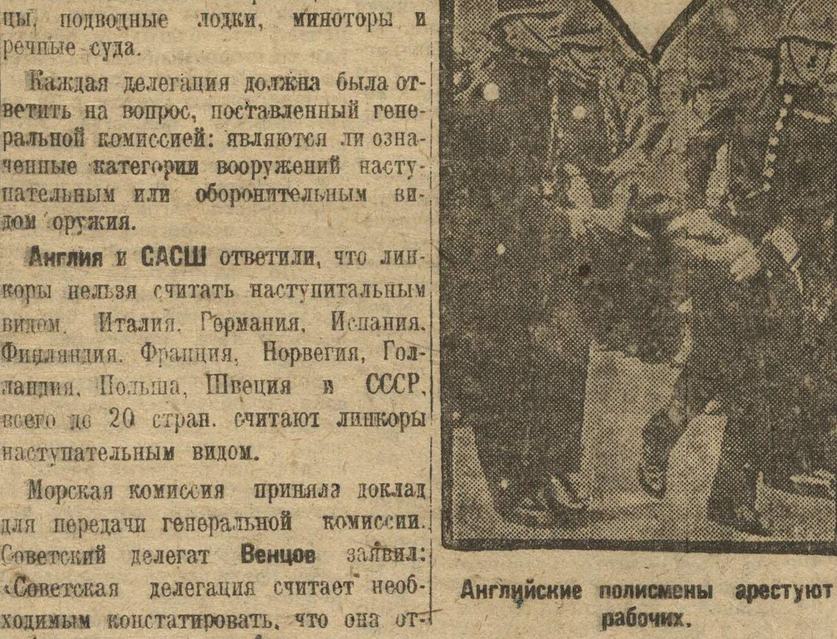
Английские полисмены арестуют рабочих.