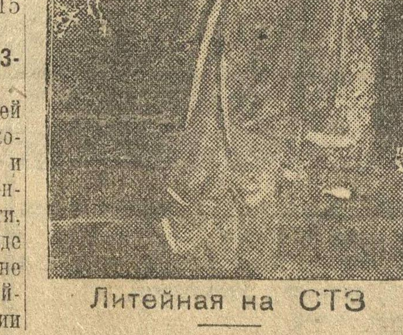
Литейная на СТЗ

КРАЕВОЙ СОВЕТ КУЛЬТУРНОГО СТРОИТЕЛЬСТВА.