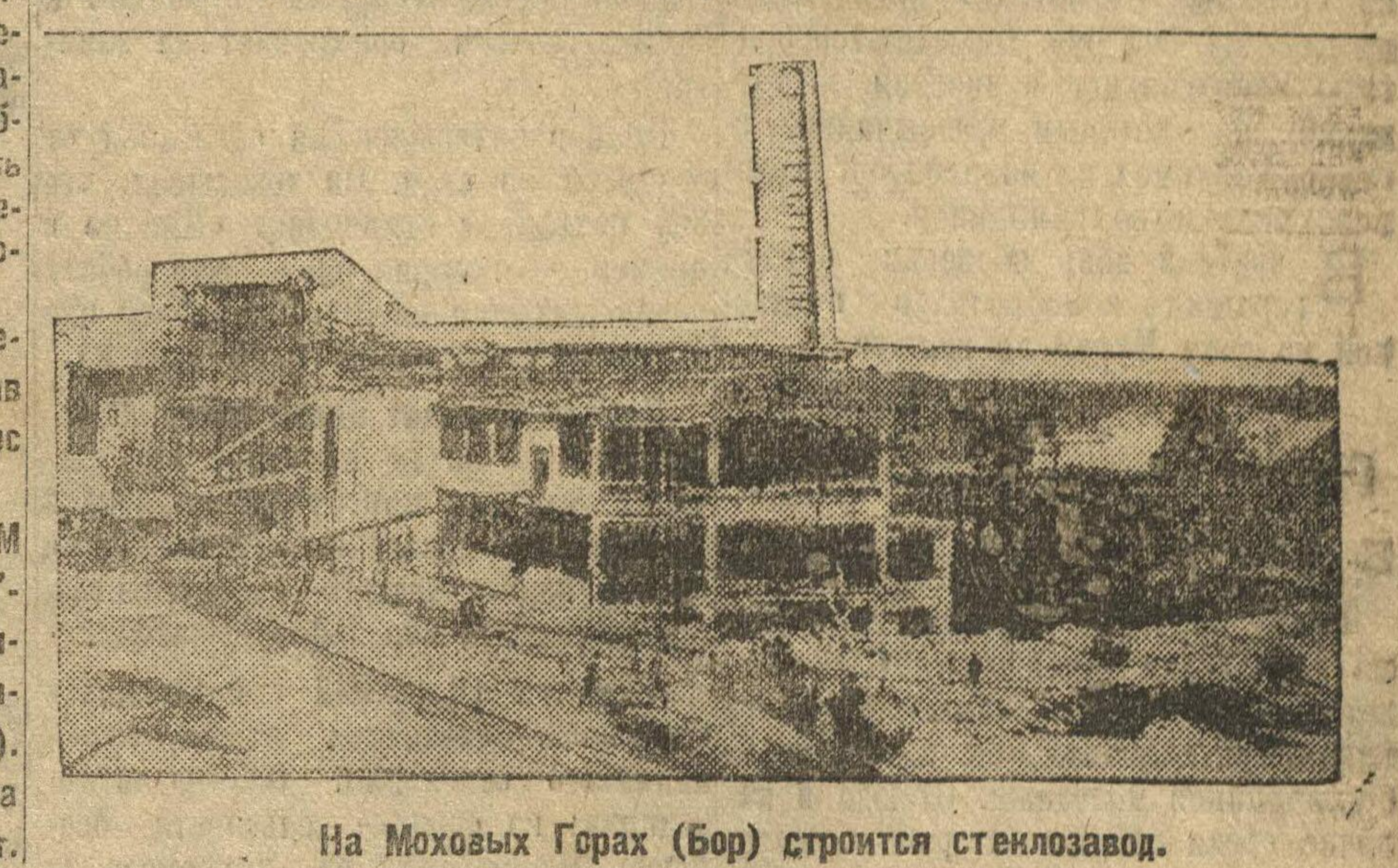
На Моховых Горах (Бор) строится стекловод.