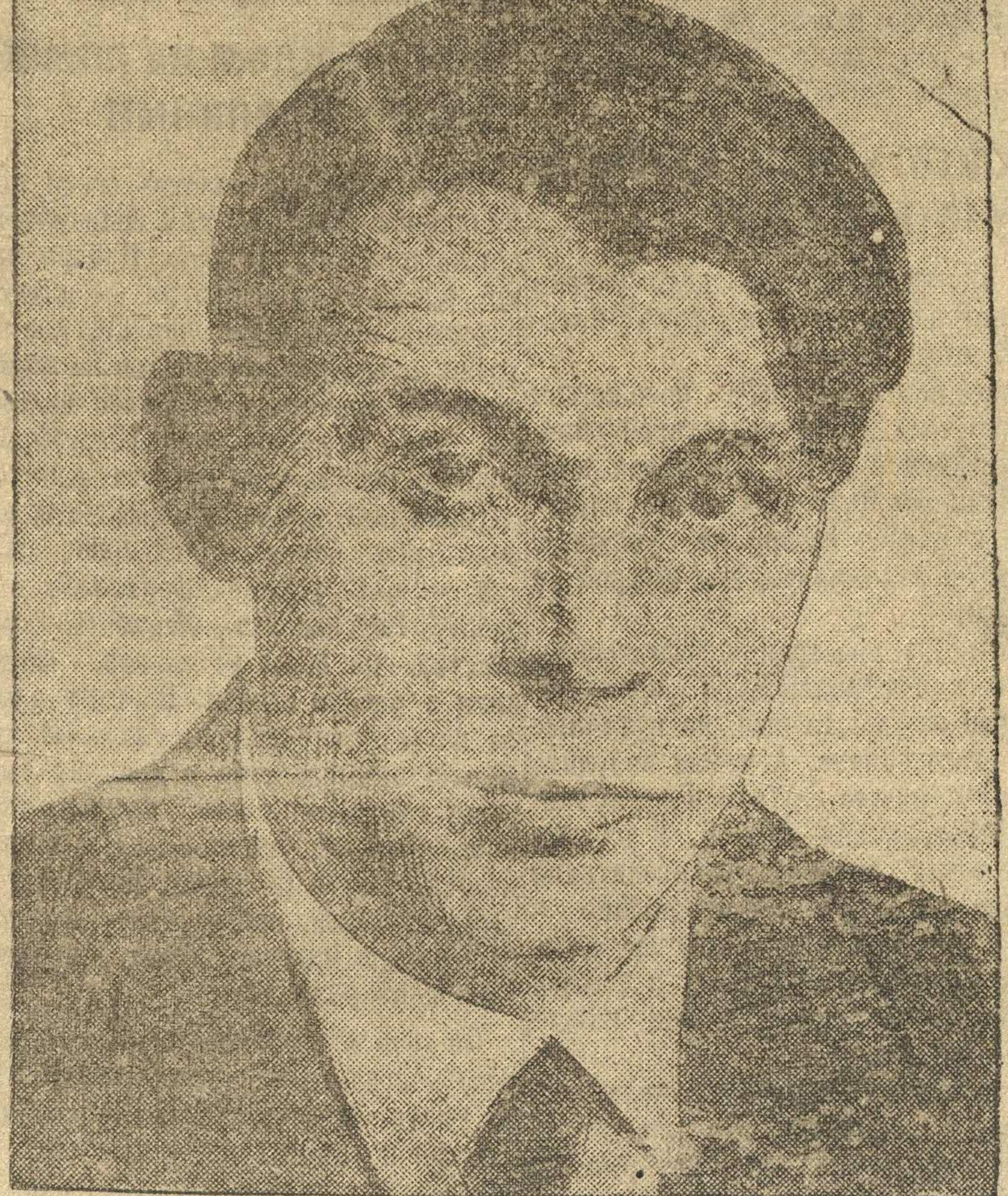
КОСАРЕВ, генеральный секретарь ЦК ВЛКСМ.

Обсуждение на нашем совещании вопроса об обмене комсомольских билетов носило сугубо предварительный характер, поэтому и выводы будут носить незаключенный характер. Многие наши организации, как это вскрыл обмен билетов, недоучитывают всей сложности политической обстановки нашего развития, а иногда не понимают конкретных форм проявления классовой борьбы, не разбираются «что к чему». В частности, это сказывается в либеральном отношении к чуждым элементам со стороны отдельных ячеек, в силу чего эти ячейки недостаточно вскрывают чуждые элементы, присосавшиеся к комсомолу. Нам требуется, не дожидаясь окончания обмена билетов, сильнее нажать на выявление всех классово-чуждых, примазавшихся к комсомолу, и окончательно отрезать союз от их присутствия. Надо подчеркнуть, что общий недостаток совещания состоит в том, что в прениях было мало поставлено боевых вопросов комсомольской работы. Создается впечатление, что секретари областных и краевых комитетов комсомола над этими вопросами мало думали и кампания обмена комсомольского билета рассматривают узко. Я бы сказал, что эти боевые вопросы работы руководителями обкомов и крайкомов подмечались недостаточно.