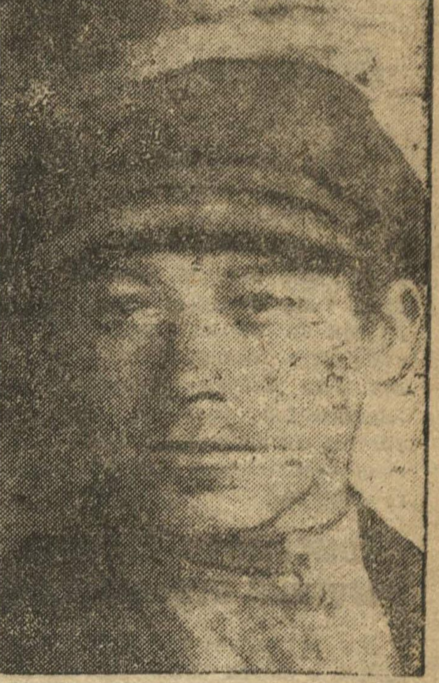
Делегат конференции ДАНИЛОЗ (Можгинский колхоз).

Воротынец. Начало сеноуборки по району предполагалось 15 июня, но лишь только к 20 июня несколько колхозов (Огне-Майданский, Финский) начали сенокос. До сих пор район еще не вступил в массовое сенокосение. В ряде колхозов считают, что сеноуборку сейчас начинать не целесообразно, т. е. трава еще не выросла. Райзо и Райколхозсоюз до-