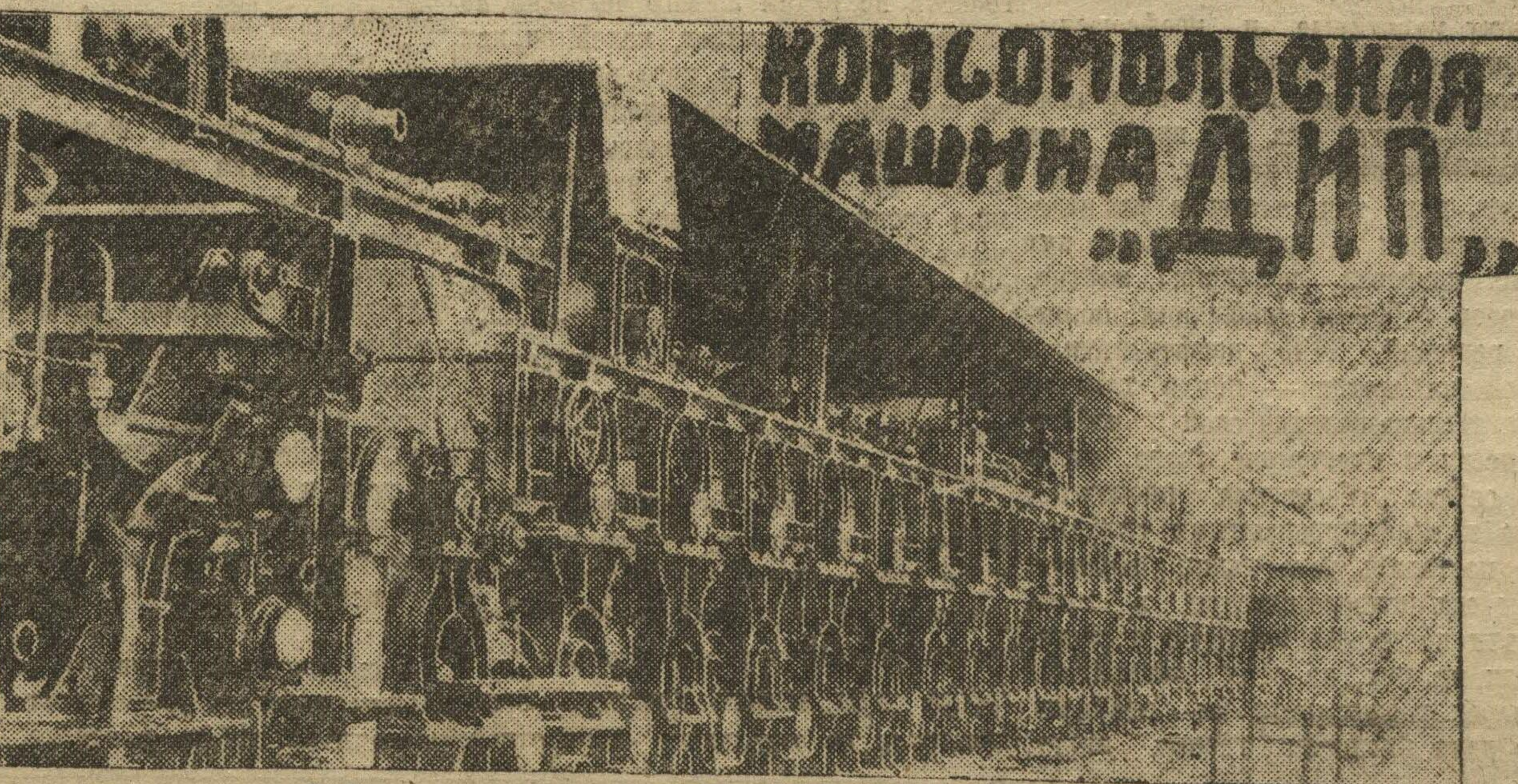
Комсомольская машина «ДНП» № 3, которая систематически перевыполняет производственное задание.

ПРЕНИЯ ДАЮТСЯ ПО СОКРАЩЕННЫМ ОТНОГРАММАМ