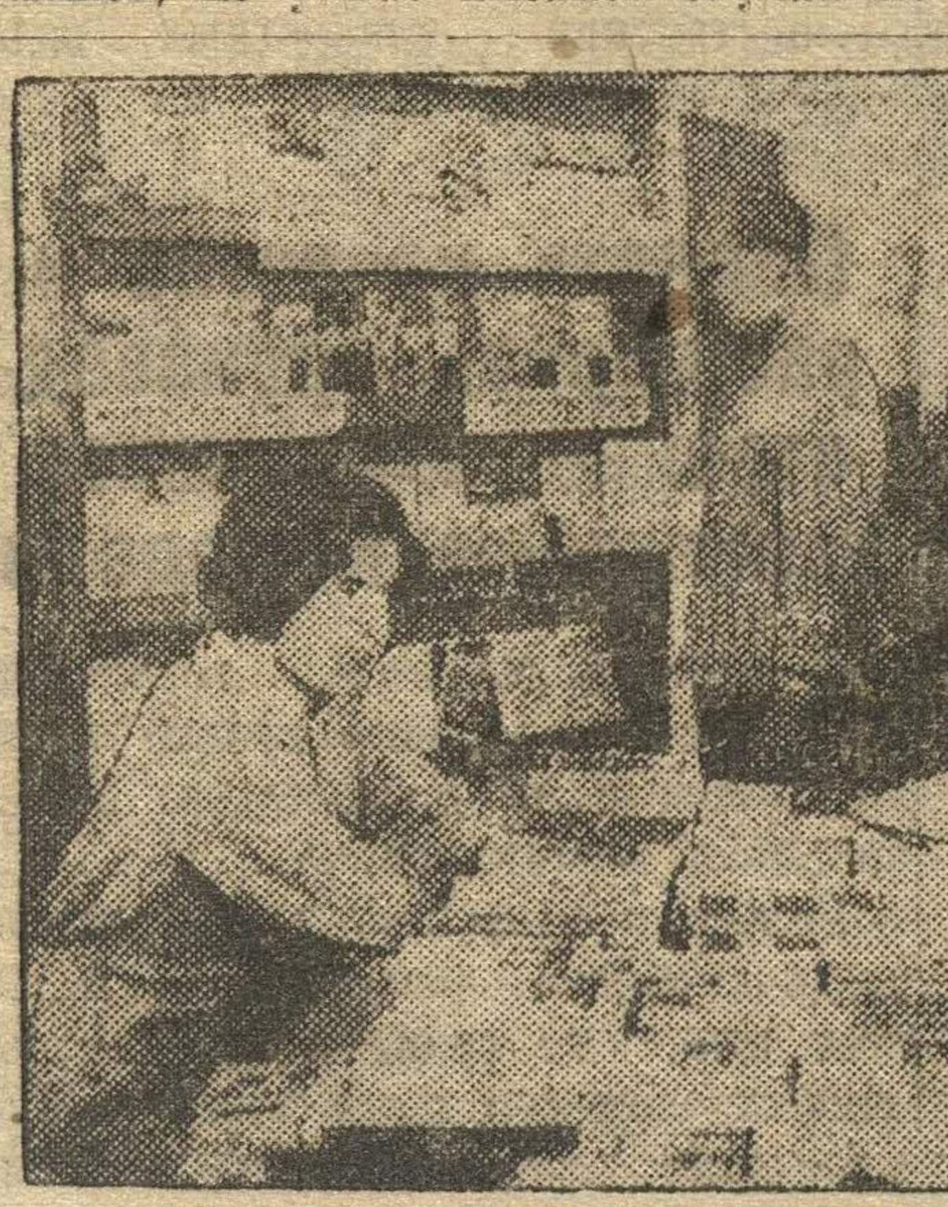
Делегаты III Краевой покупают литературу.