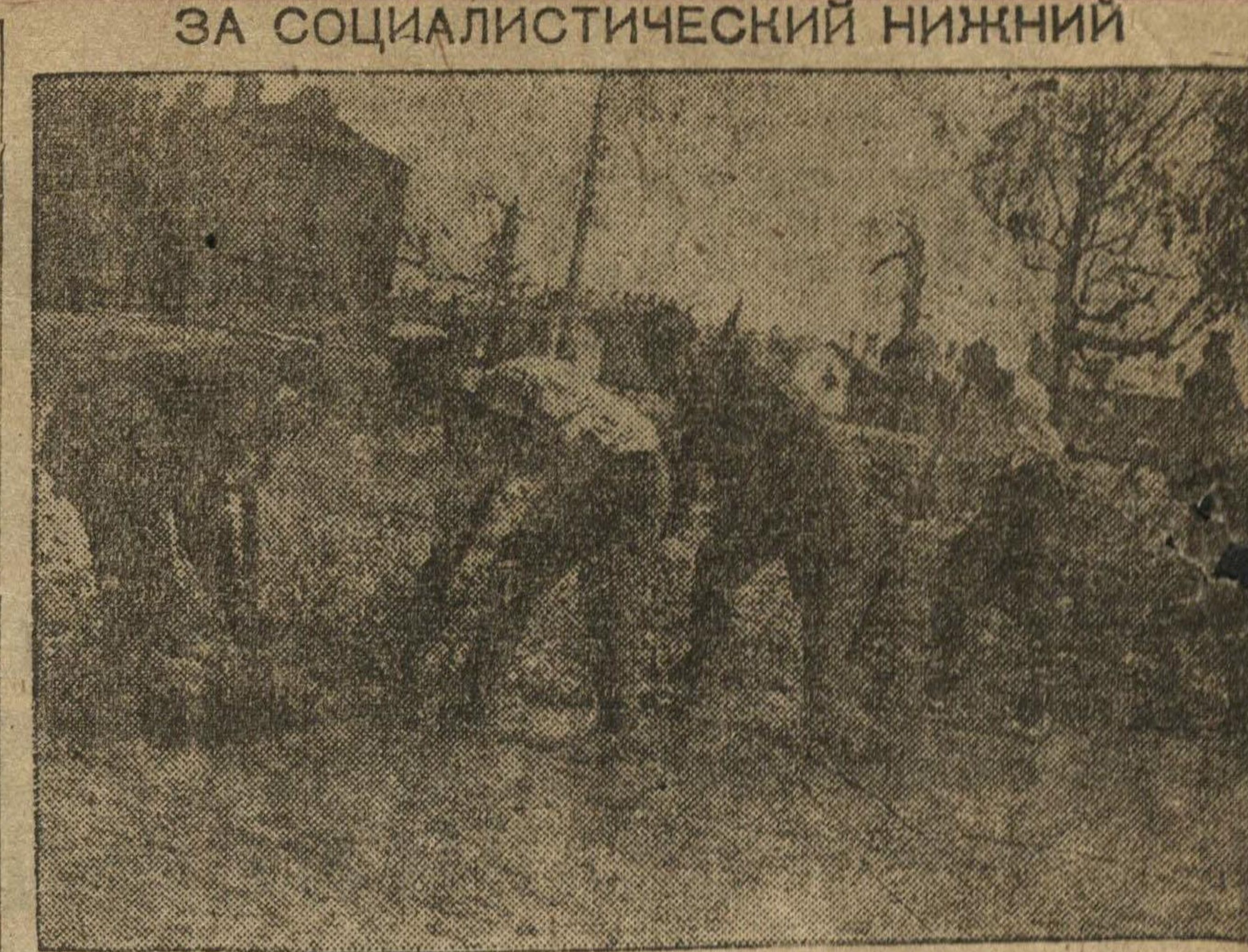
Комсомольцы ячейки седьмой школы милиции за разборкой старого шоссе Нижний-Мыза.