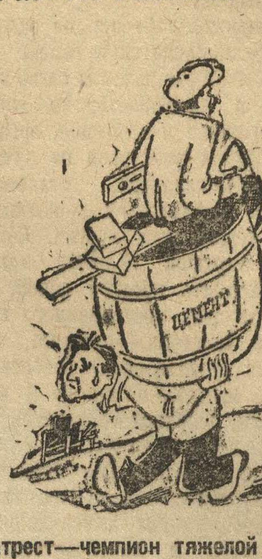
Театрест — чемпион тяжелой атлетики

что этот цемент сейчас передан на другие более ответственные (!) участки работы.