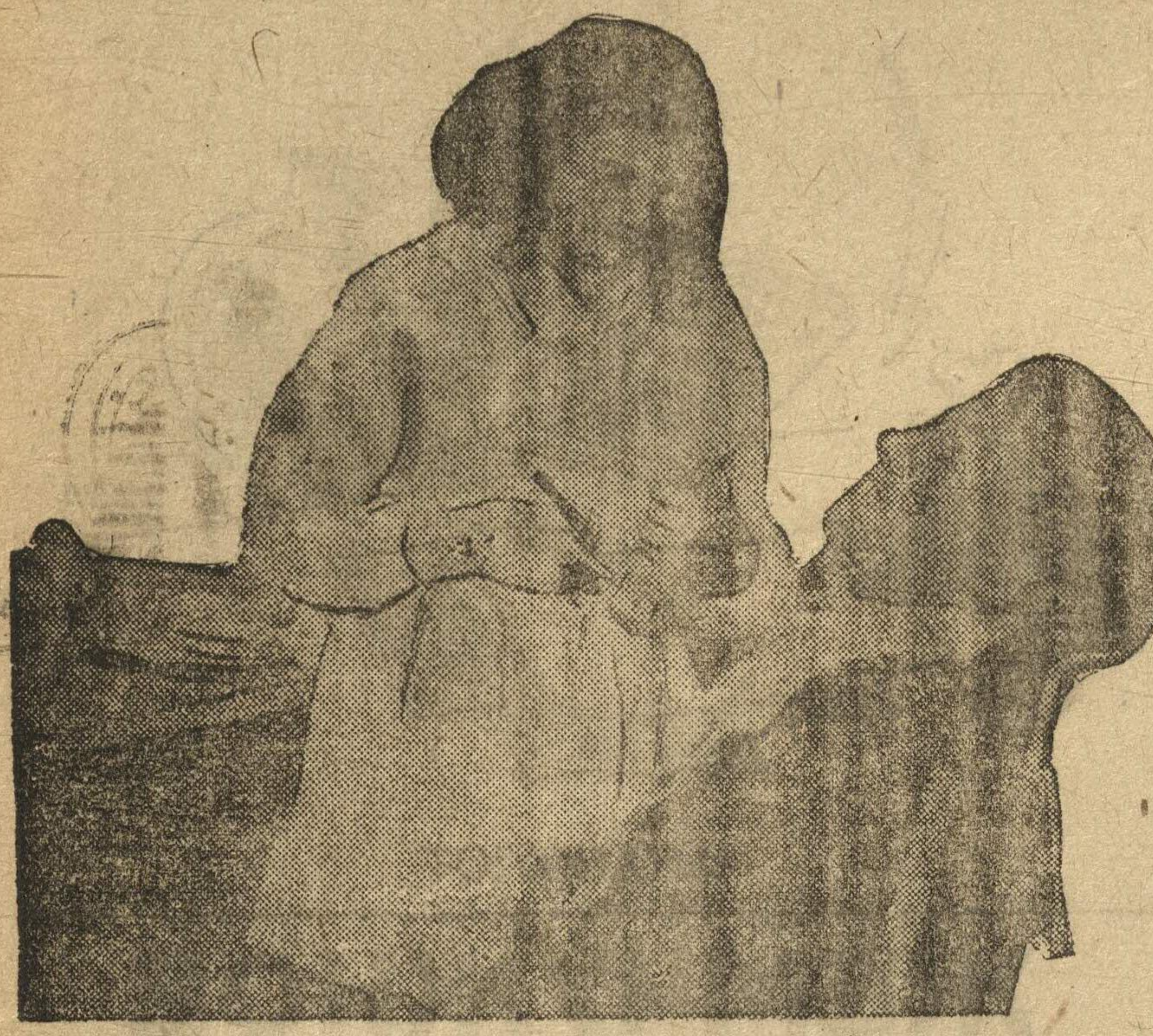
Вновь открывается парикмахерская в пресовом цехе