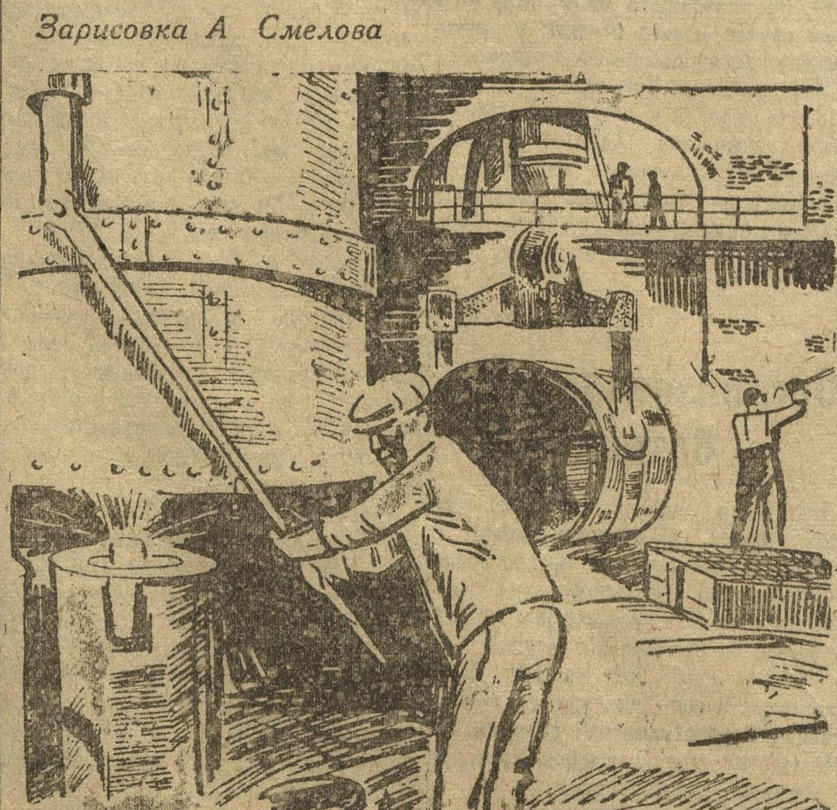
Зарисовка А. Смелова