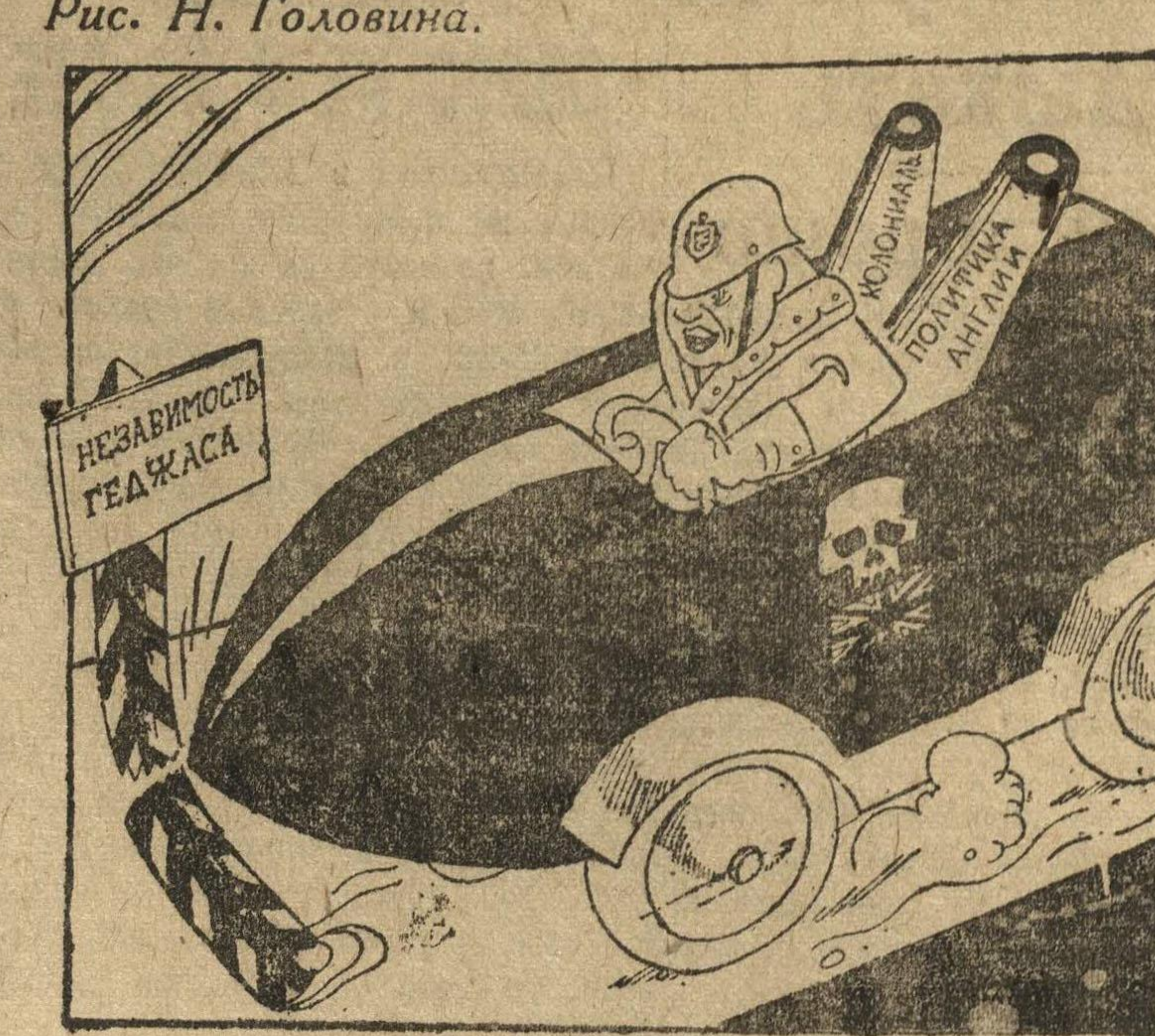
Рис. Н. Головина. ПО ПУТИ ИЗ ЖЕНЕВЫ