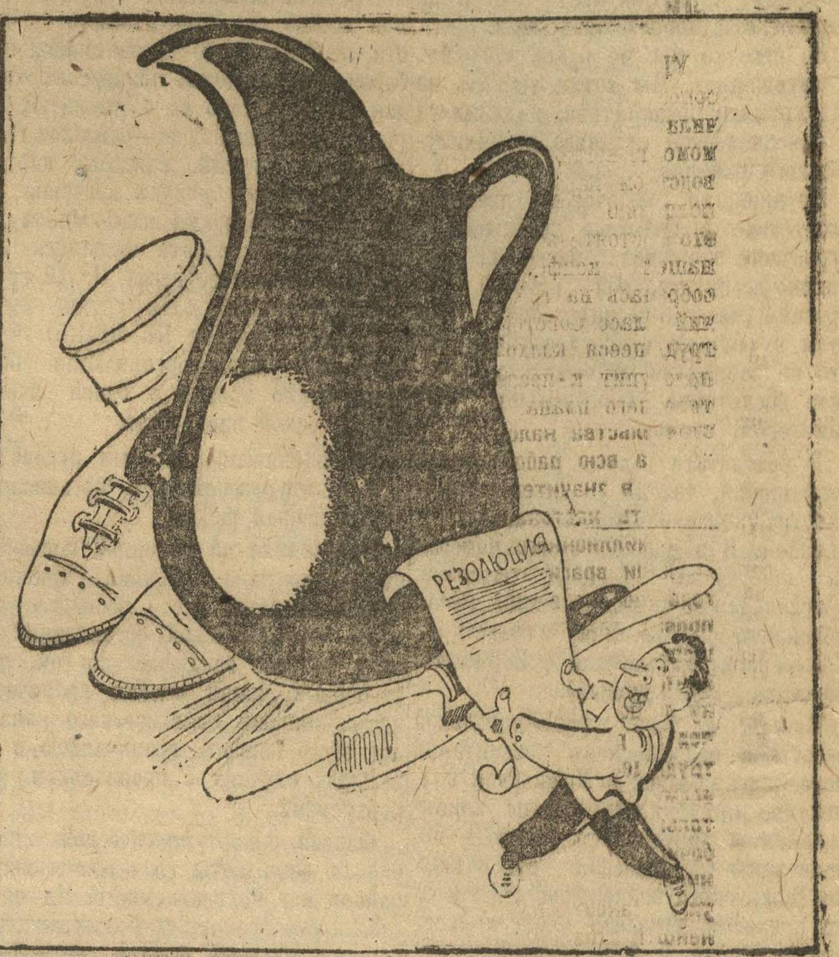
Нам, товарищи, надо заниматься мелочами, заниматься производством предметов ширпотреба: обуви, посуды, одежды и т. д. До сих пор этим делом, мы занимались мало.

Рис. Н. Головина УЗКИЙ ПОДХОД К ШИРПОТРЕБУ