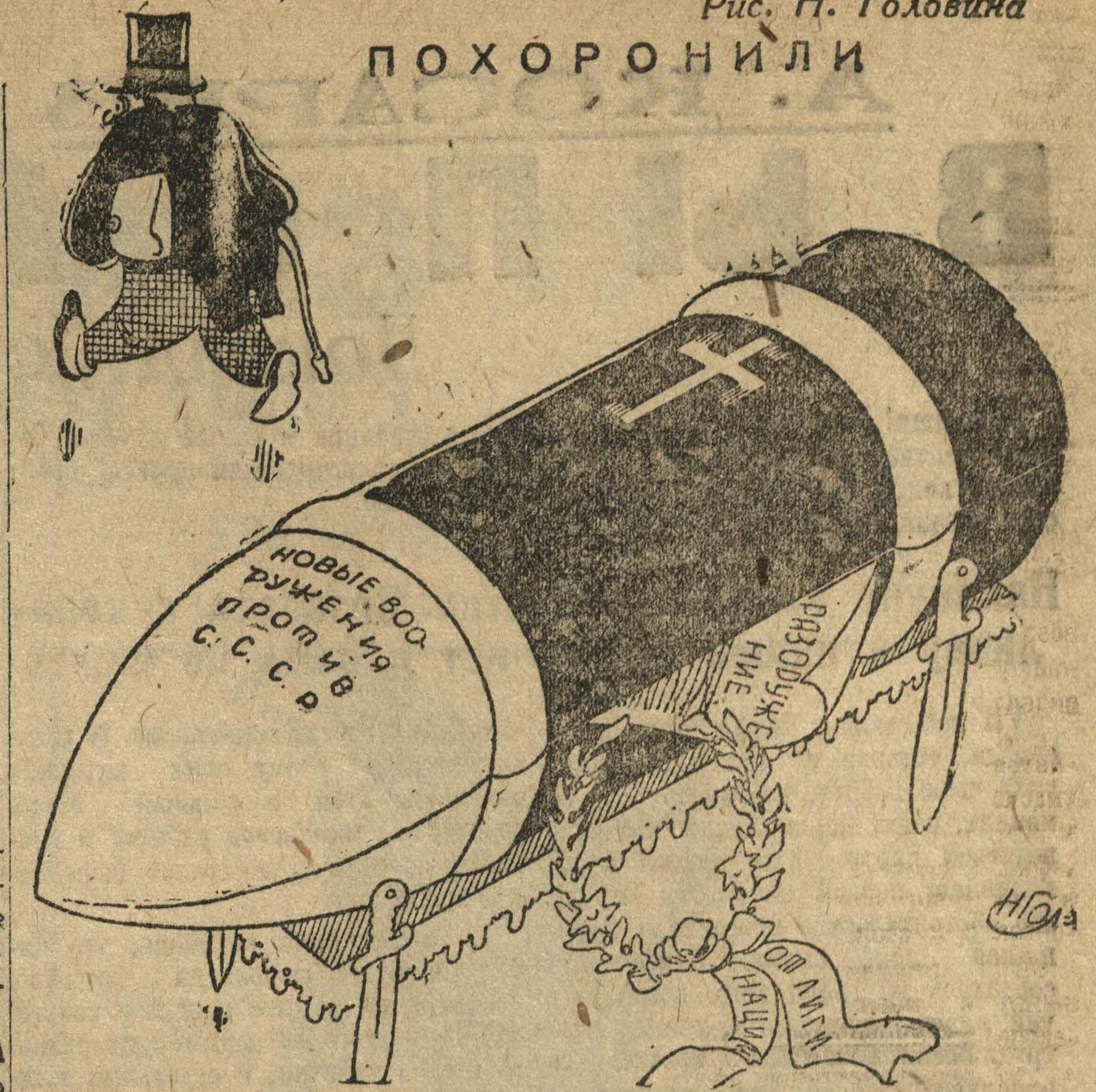
Рис. Н. Головина

Доклад генерального секретаря ЦК ВЛКСМ т. КОСАРЕВА об итогах VII всесоюзной конференции ВЛКСМ читайте в сегодняшнем номере „Ленинской Смены“ (2 и 3 стр.)