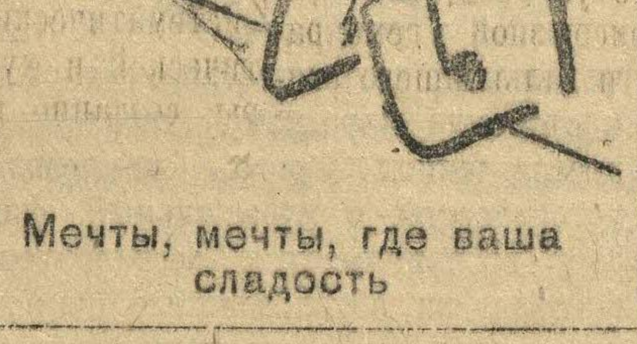
Мечты, мечты, где ваша сладость