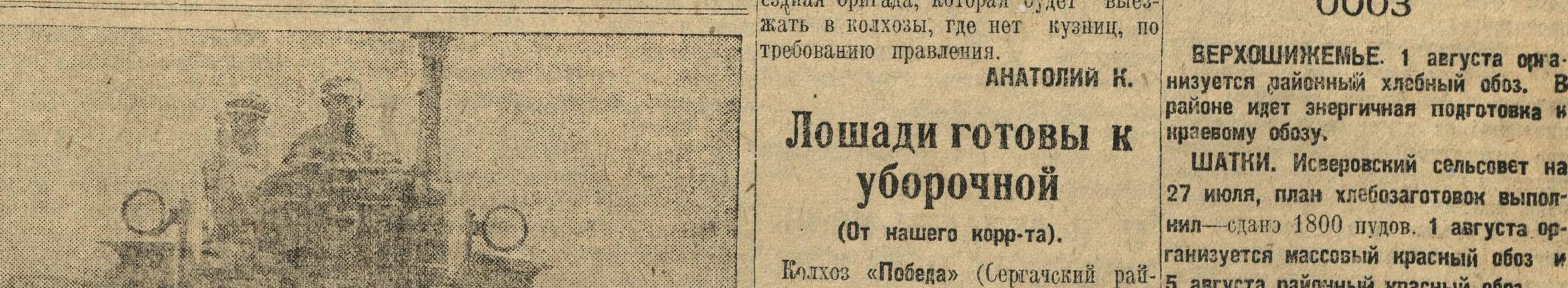
Советский тракторный культиватор — на колхозных полях

Самосборка должна работать 16 часов в сутках, с выработкой 8 га; ижевикская должна работать 15 часов, с выработкой в сутках 9 га; сноповязка тракторная должна работать 16 часов в сутках, с выработкой 13 га.