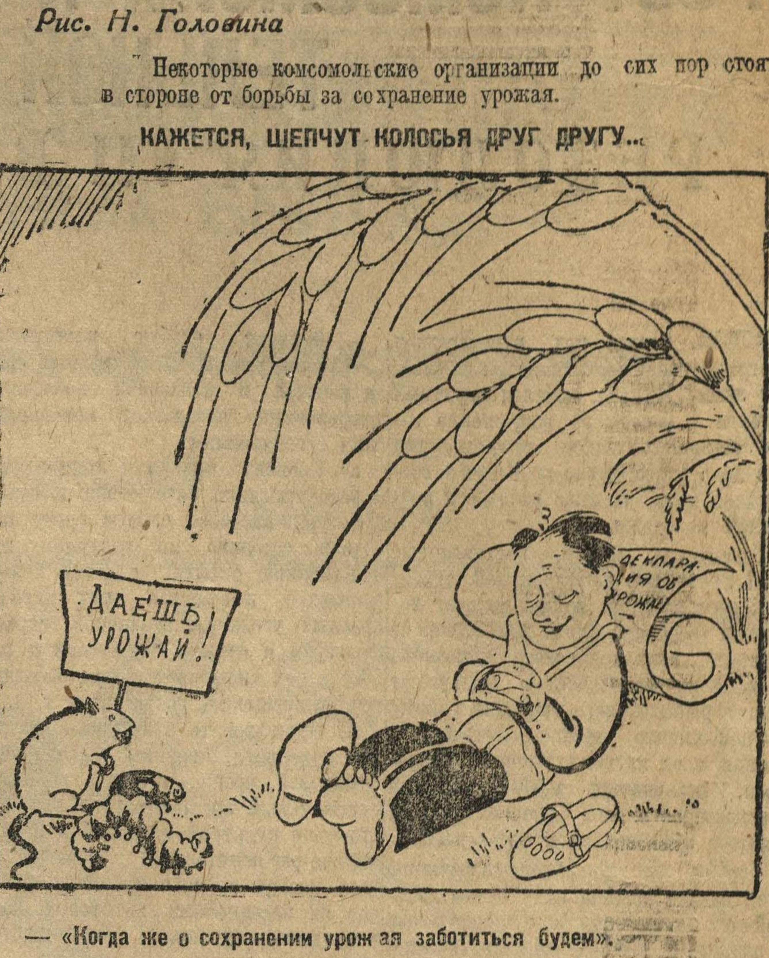
«Когда же о сохранении урожая заботиться будем»

Выполнение планов уборочной и хлебозаготовочной кампании.