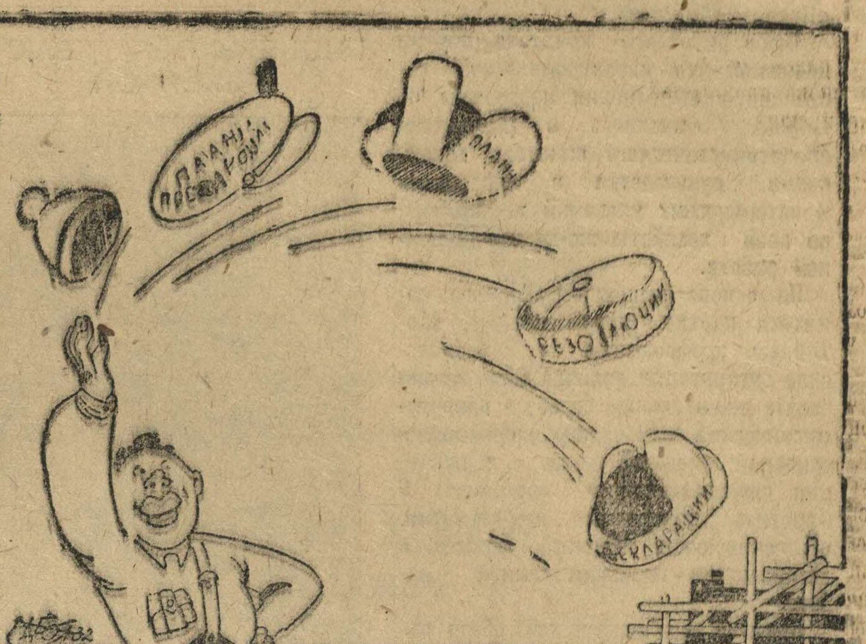
—Что, прерыв на строительство?.. Шансами закидаем!