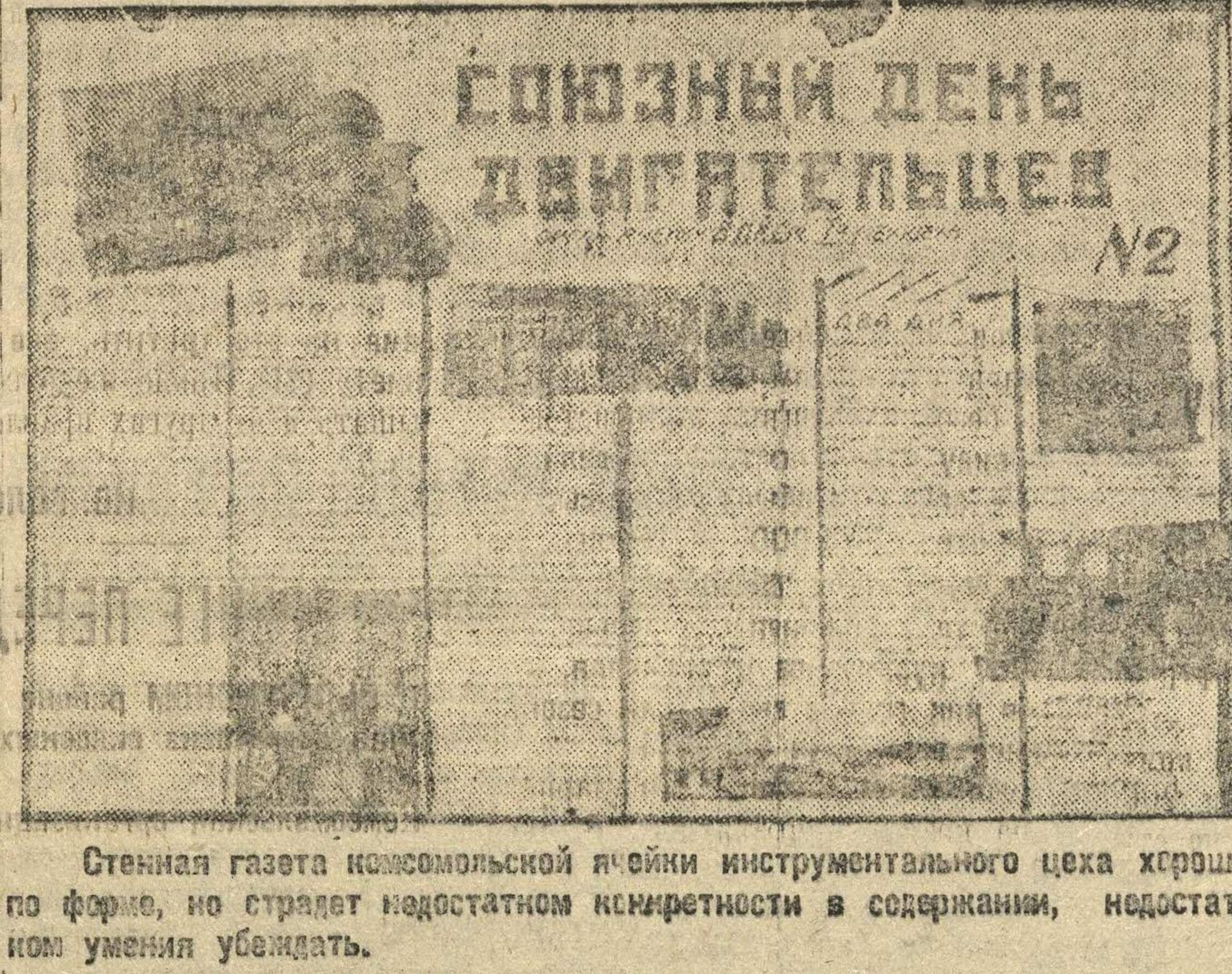
Стенная газета комсомольской ячейки инструментального цеха хромистого ферро, но страдает недостатком конкретности в содержании, недостатком умения убеждать.

Массовая агитация, разъяснение и пропаганда основных решений «Приказа Революции» — это основная работа агитатора. Агитатор должен быть организатором, пропагандистом и политическим работником. Агитатор должен быть организатором, пропагандистом и политическим работником. Агитатор должен быть организатором, пропагандистом и политическим работником.