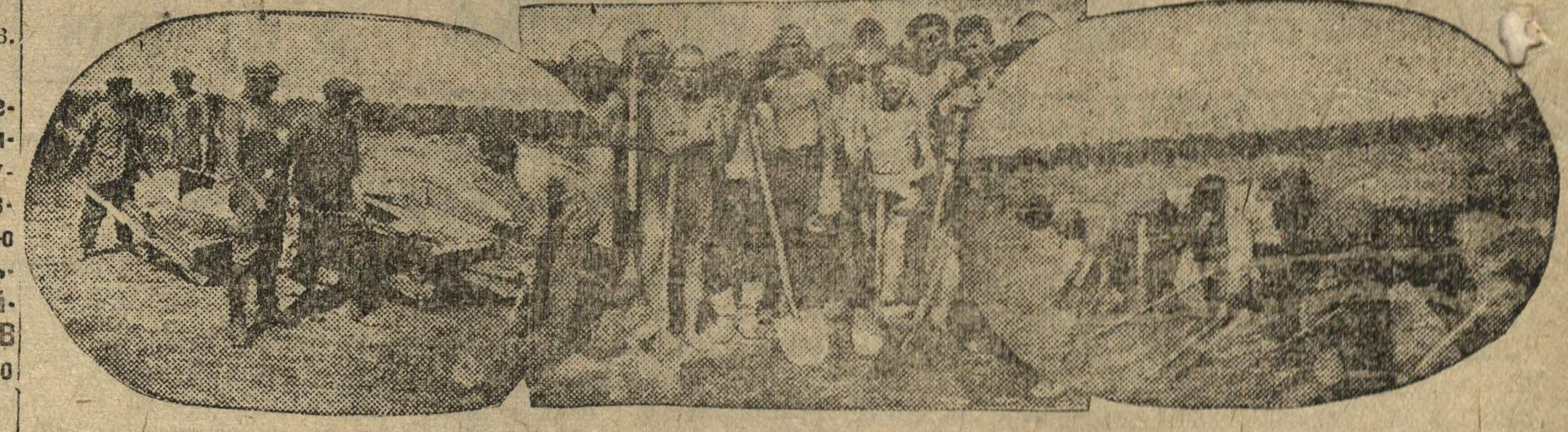
В СЕРЕДИНЕ: Третий взвод 4-й роты. Бригада ОКСТОНА выполнила задание на 218 проц. СПРАВА В ОВАЛЕ: третий взвод 4-й роты, отделение ВЛАСОВА выполняет задание до 336 проц. СЛЕВА В ОВАЛЕ: третий взвод 4-й роты бригада СУВОРОВА выполняет задание до 270 проц.

некоторые ротах рабочие темпы работы, невыполнение заданий.