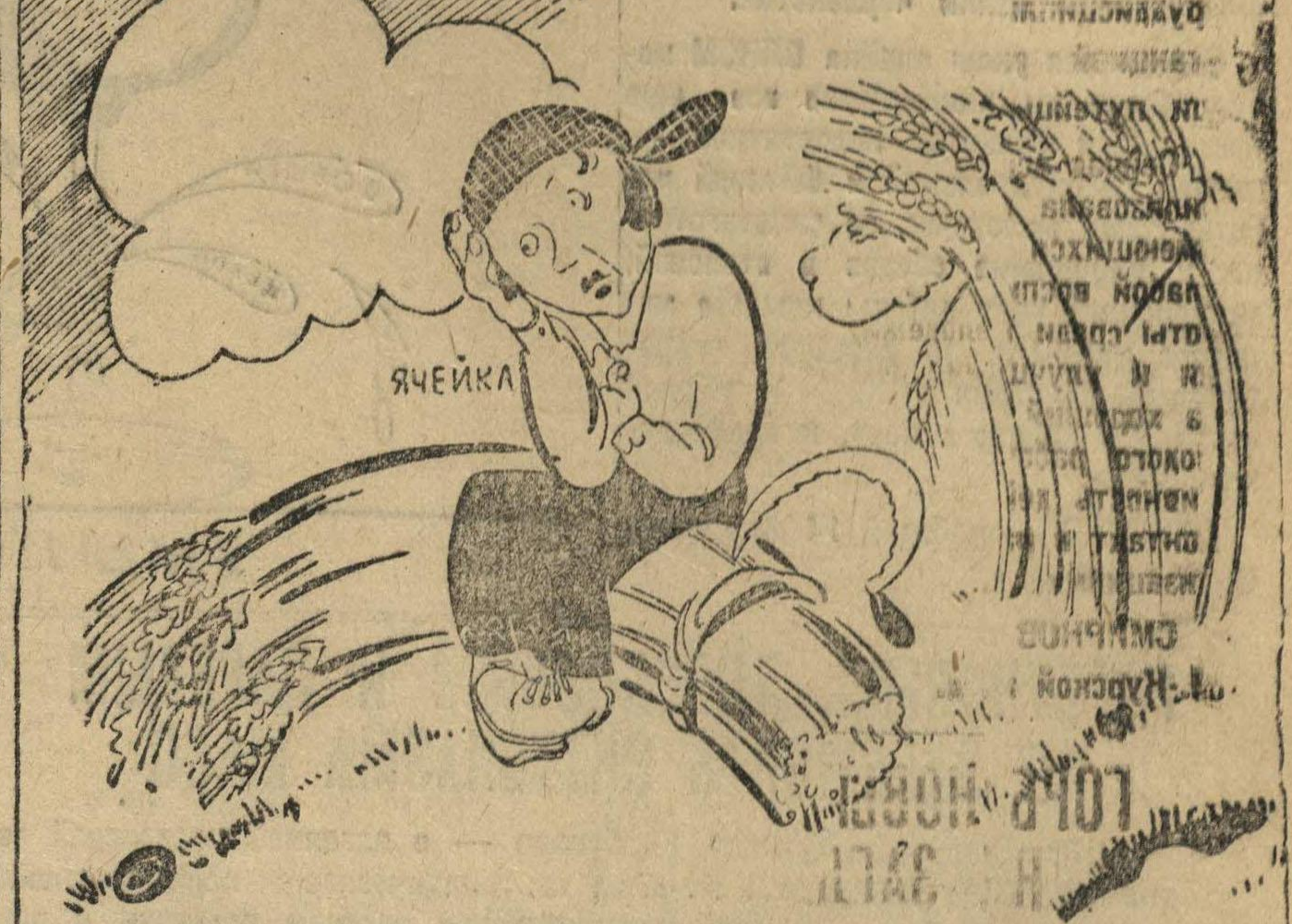
Раз полосу Маша жала, золоты снопы взошла... притислась...

Выездная ячейка «Ленинской Смены» — Ив. СУЛОВ.