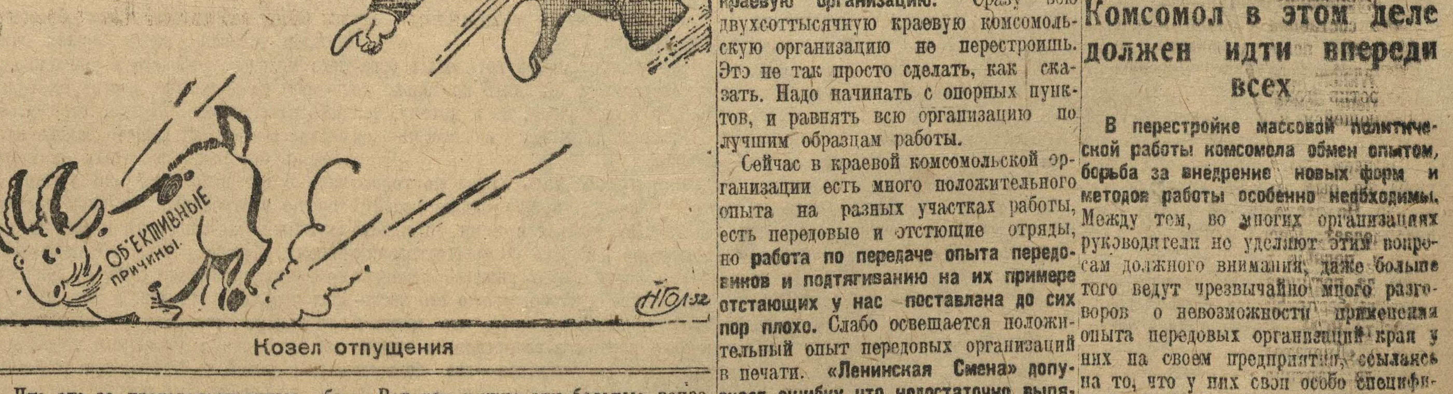
Рис. Н. Головина

Вот как нужно эти большие вопро- сы? Дополнительные производствен- ны вам, комсомольцам, — ударной бри- гадной базе — это крило, это — стино- гаде рабочего класса и передово- порточные пункты, это — огород. Для молодежи нашей партии, — стоять в более крупных предприятий стоит во- себя на предприятии и бороться за прогр. Ряд заводов уже ставят эти яичи ответственных задач, и претупает к его практике. Плоха работа той комсомольской со- цию разрешению путем создания мо- яички, в цехе которой царит беспло- дных ферм. Каждый завод может и яичи в столовой плохой корням ра- должен создать для себя яичную про- бочку. Грош цена такой «работе», можно сделать еще очень много, созданию необходимых условий для создания свинооткормочных рабочих в цехах не осуществятся. Нет и не должно быть у нас такой откормки свиной мы имеем много от- отвлеченной, отдаленной от жизни массово-политической работы. Если можно сделать еще очень много, созданию необходимых условий для создания свинооткормочных рабочих в цехах не осуществятся. Нет и не должно быть у нас такой откормки свиной мы имеем много от- отвлеченной, отдаленной от жизни массово-политической работы. Если