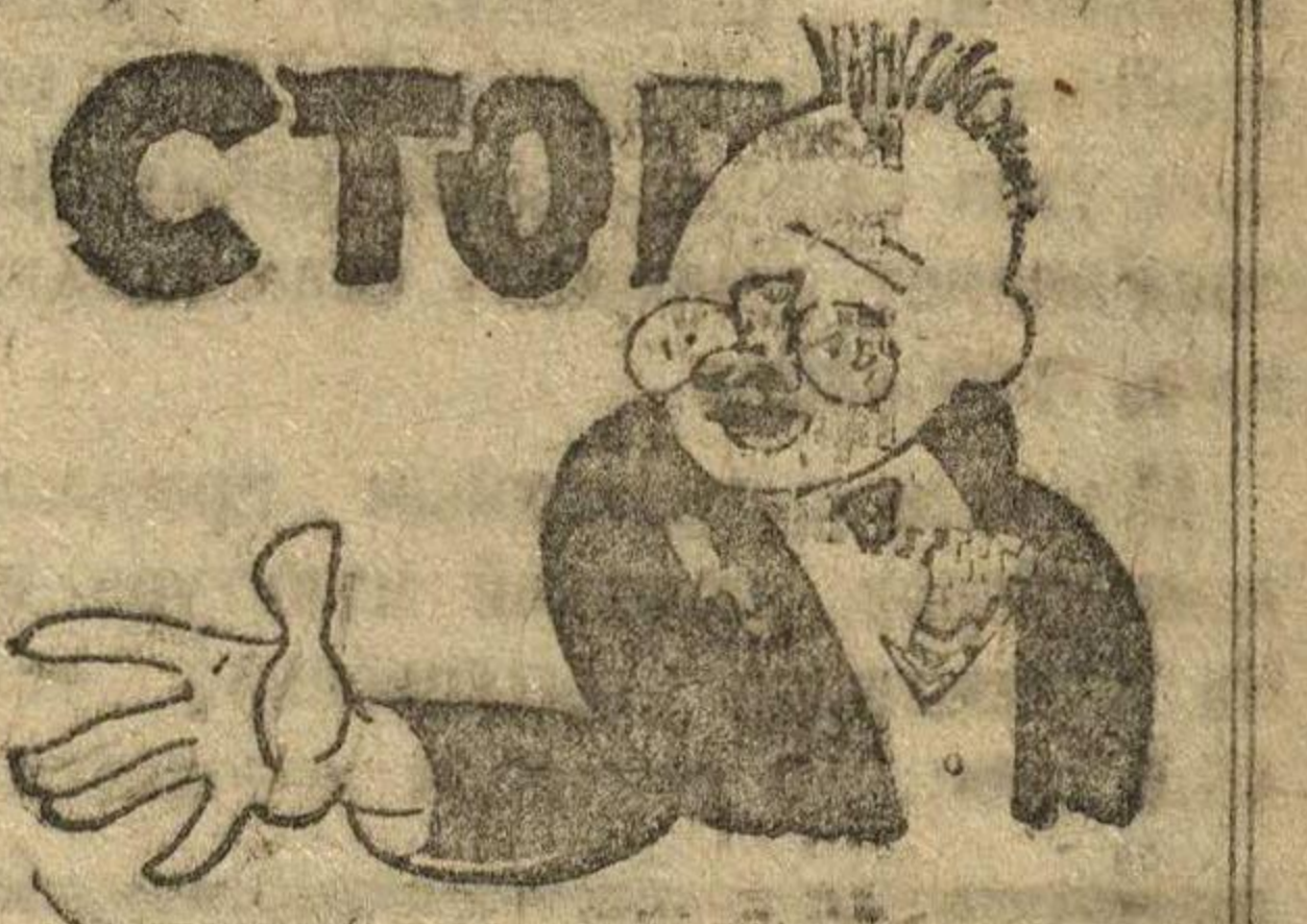
Рис. Н. Головина.

— Что, овощезаготовки? Мы готовы! Правда, кое-что еще не сделали, но это пустяки! НАКОНЕЦ!