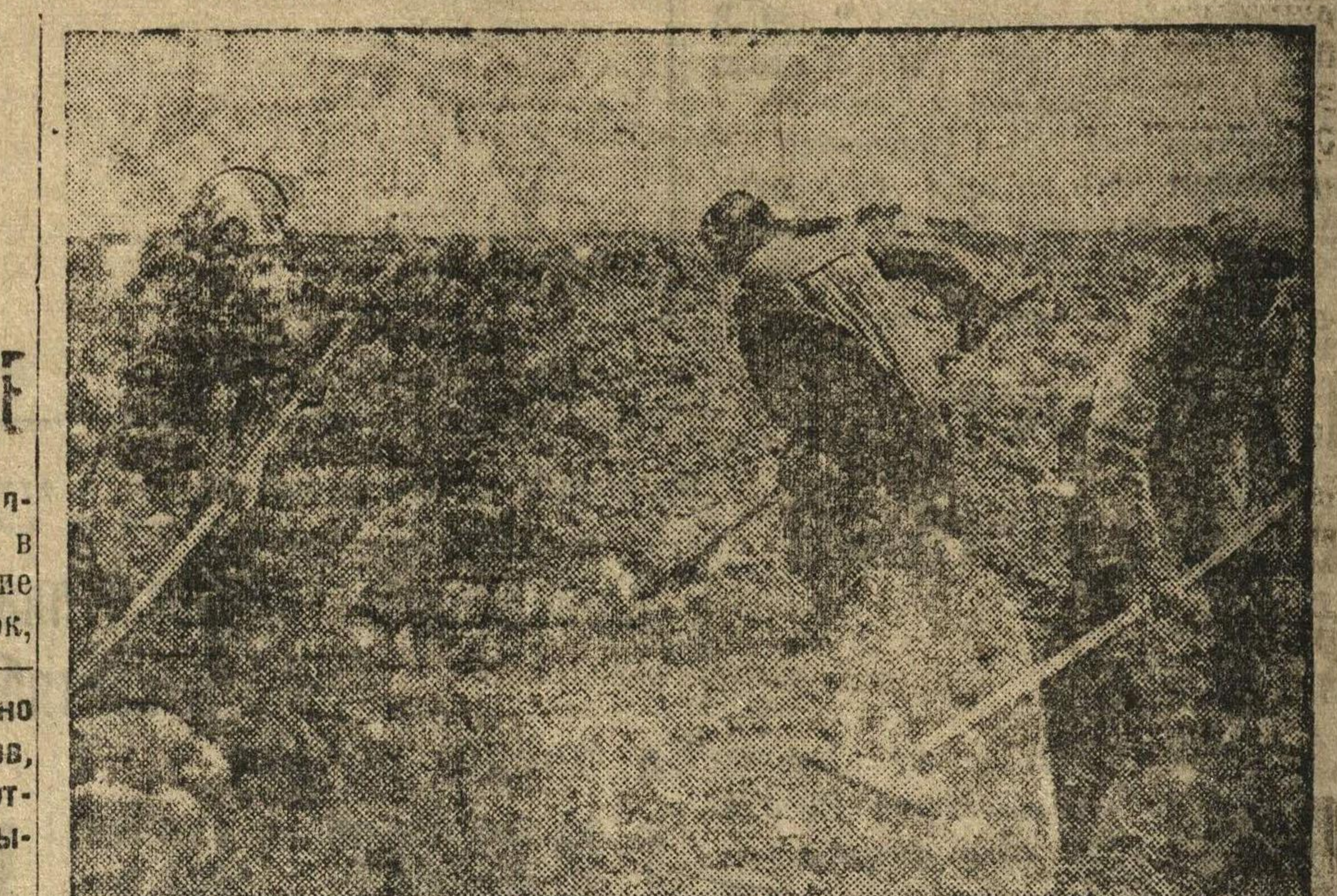
Сгребание колосьев после уборки снопов.