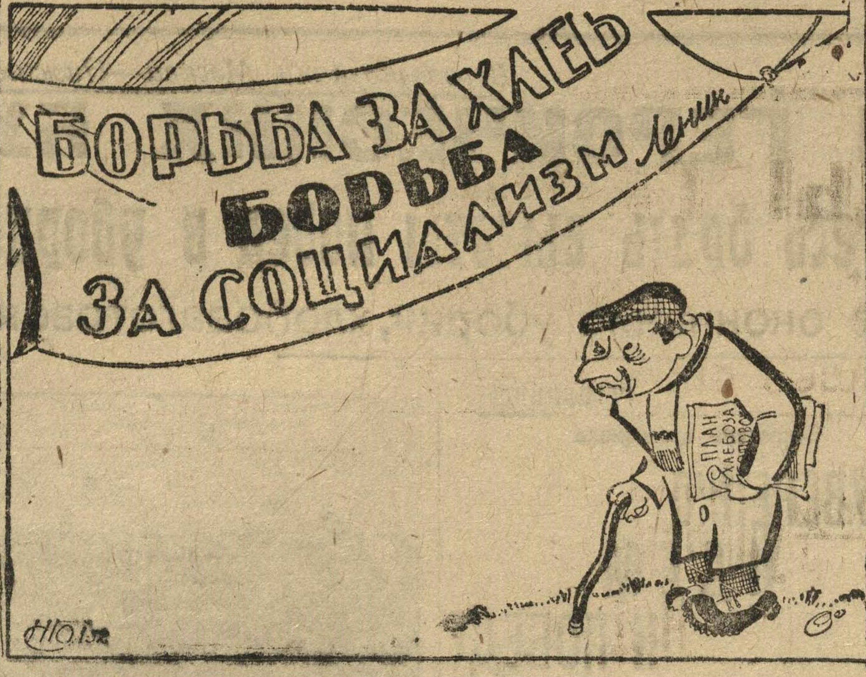
Некоторые комсомольские ячейки, с стараясь планы, и это называют «борьбой за хлеб».

В БЕСПОЩАДНОЙ БОРЬБЕ С «ЛЕВАЦИМ» ИГНОРИРОВАНИЕМ ЕДИНОЛИЧНИКА И ПРАВОПЛУРТИСТИЧЕСКОЙ ПОБЛАЖКОЙ КУЛАКА — ОБЕСПЕЧИТЬ ПЕРЕЛОМ В ХЛЕБОЗАГОТОВКАХ НЕ СТОИМ В СТОРОНЕ