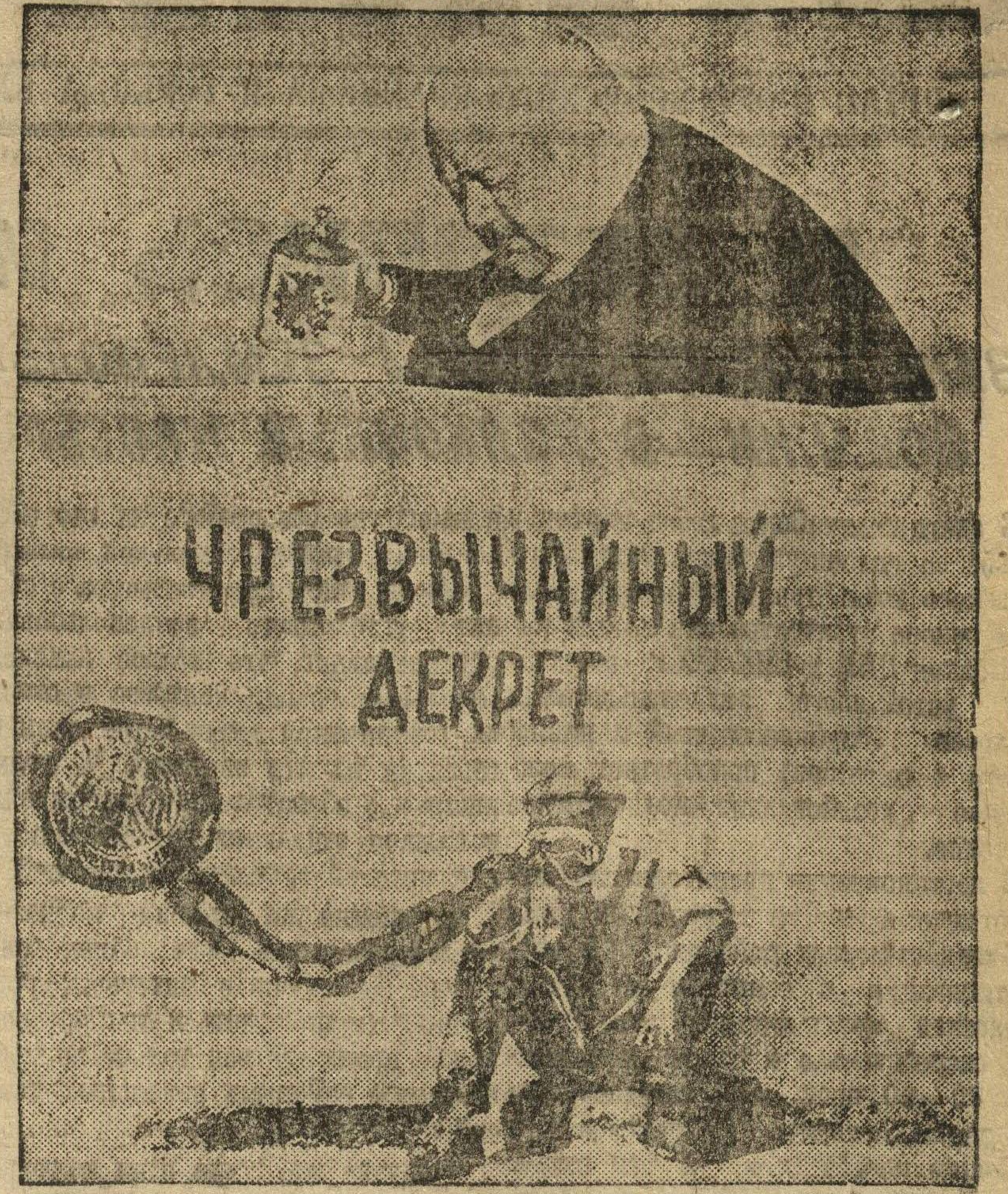
НА СНИМКЕ: капиталист рабочему: «Итак, поделим пополам наложенное бремя».