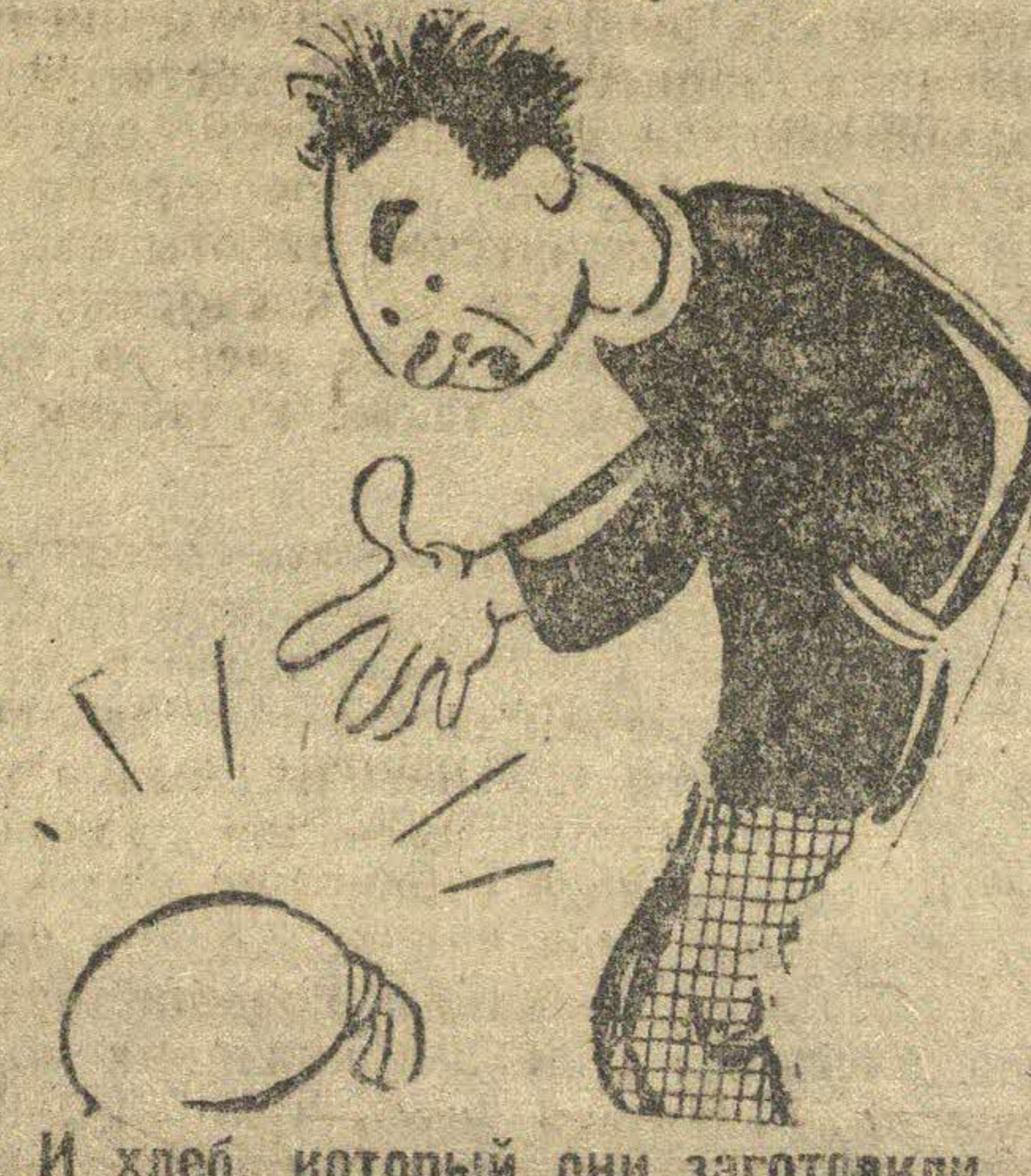
И хлеб, который они заготовили.

Комсомольские ячейки при возглавах ком. Мартынова и «Красный пахарь», И. Горского сельхозста (Курьянской район), благодаря упорной и настойчивой работы, добились того, что их колхозы выполнили план хлебозаготовок. Складам ячеек КСМ организовано 8 гранных обзов с общей сдчей разнанных и дранных культур 4638 пудов. Собрано свыше 100 мешков.