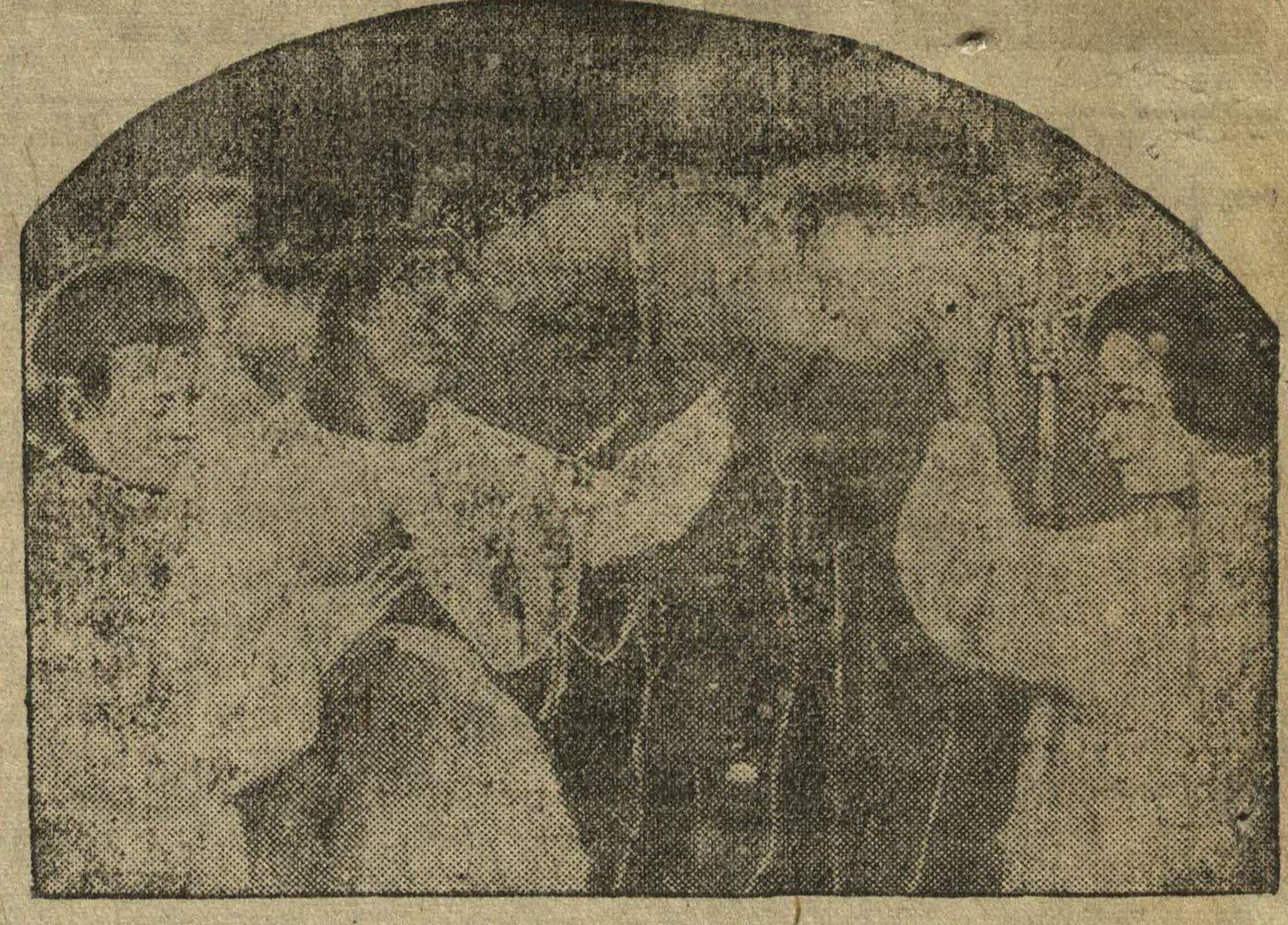
На снимке: лечение лучами кварцевой лампы («Горное солнце»).

В данное время институту, как никогда, требуется помощь общественности соревнования и комсомольская организация.